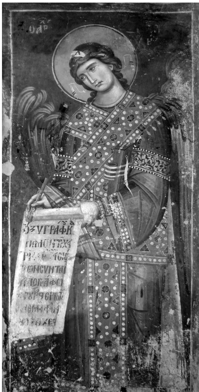
Ил. 4. Архангел Гавраил, Богородица Перивлепта в Охрид, северна стена на притвора