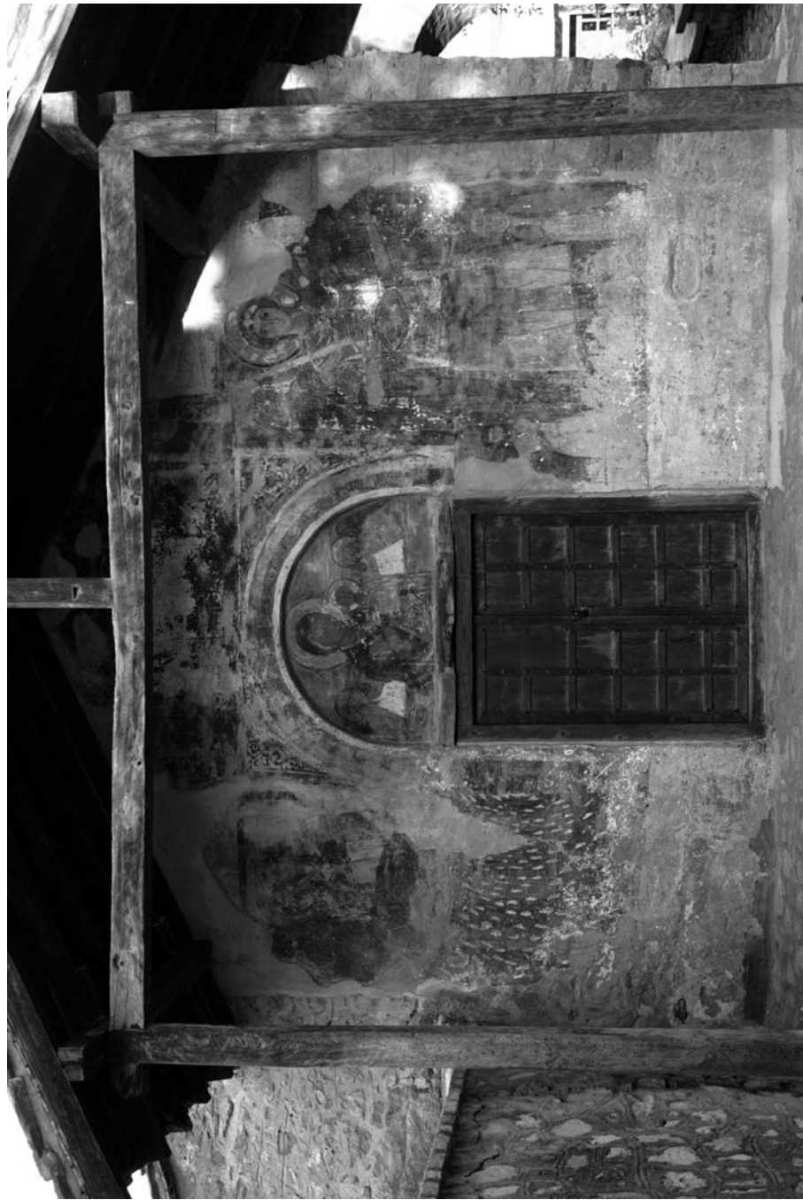
Ил. 3. Архангелите Михаил и Гавраил, църква на Такенарха (Архангел Михаил) в Костур, западна фасада