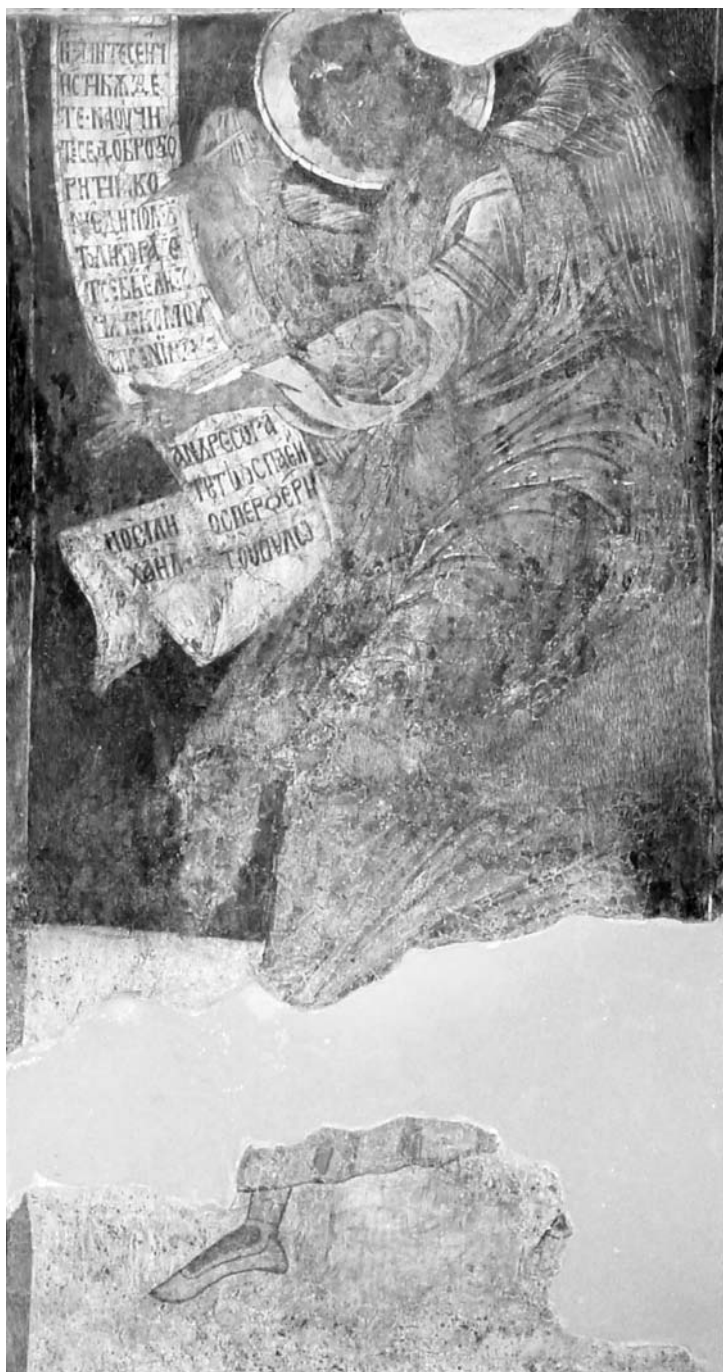
Ил. 5. Архангел Гавраил, Св. апостоли Петър и Павел в Търново, източна стена на притвора