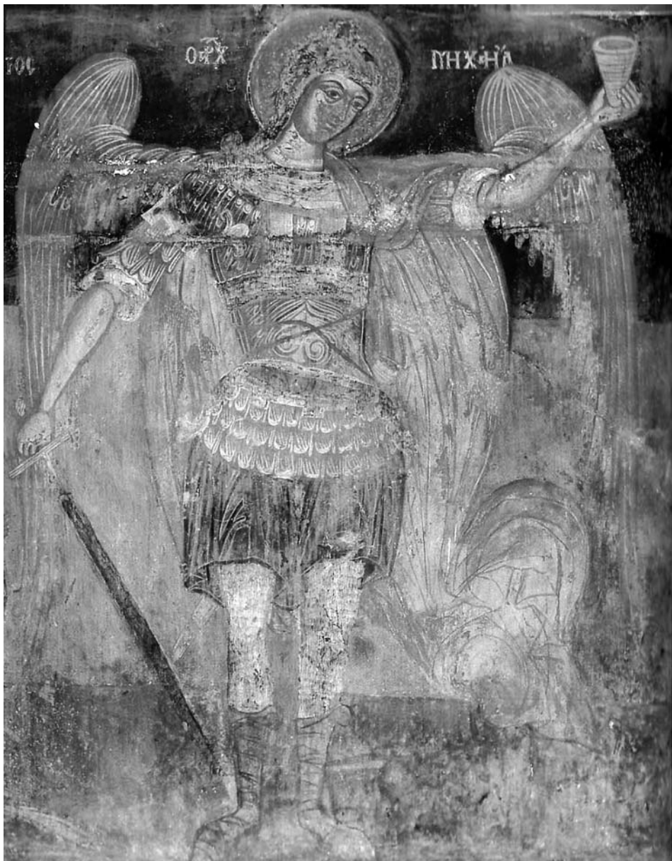
Ил. 6. Архангел Михаил, Св. Атанасий в Арбанаси, западна стена на наоса