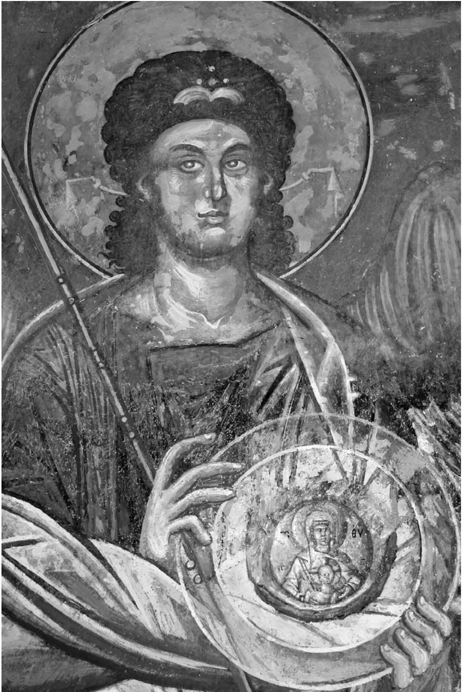
Ил. 2. Архангел Михаил, Св. Андрей на Треска, западна стена на наоса