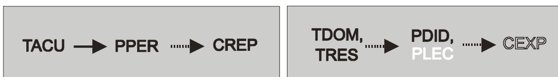
FIGURA 2. Evolución de la Complejidad para la reflexión de Ana

En la figura 2 aparece, de forma global, una síntesis de naturaleza espacio-temporal de todos los resultados obtenidos para la reflexión de la profesora, a lo largo de los dos cursos del estudio, en una concreción metafórica de nuestra Hipótesis de la Complejidad. Con el ánimo de facilitar el acceso rápido a la información, hemos adoptado una serie de claves de interpretación, realizándose en dos niveles, desde los códigos y desde las flechas que se utilizan.