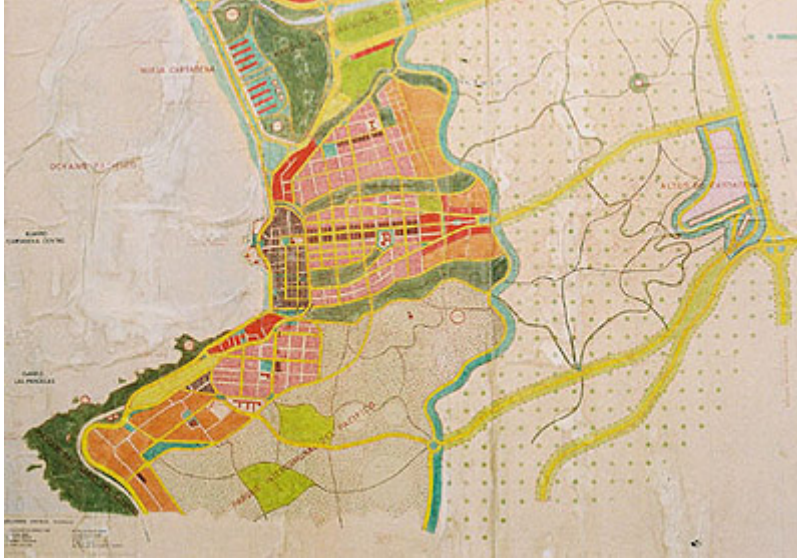
Fig. 5. "Parque intercomunal del Pacifico" (abajo) y "Micro Zona Industrial Exclusiva" en los altos de Cartagena (der.)