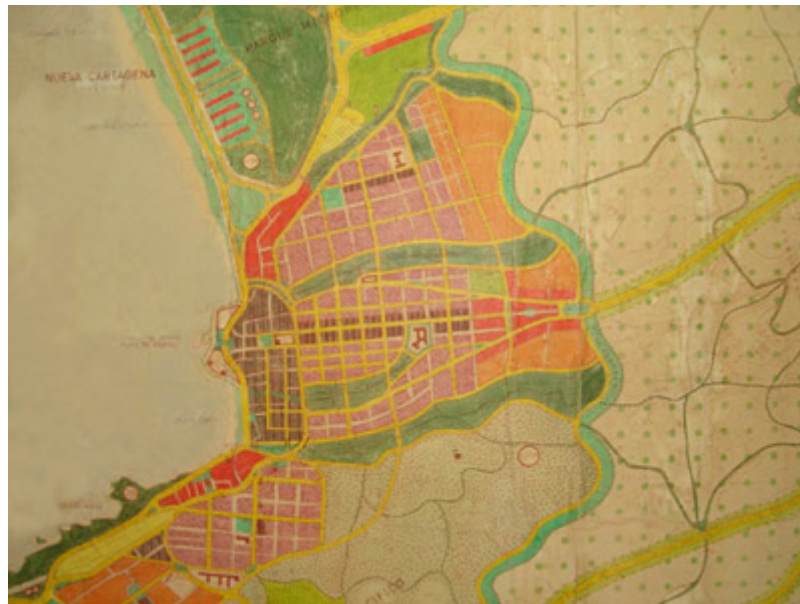
Fig.4. Proyecto de Plan Regulador de la Comuna de Cartagena 1976, DEPUR, FAU, U. de Chile no realizado. Detalle de zona céntrica.

Los parques "El Tranque", "Las Mercedes" y "Miraflores" se propusieron en las quebradas de la zona centro de la ciudad. Un "Parque Santuario del Litoral", se dispuso compartido con la comuna de San Antonio, y el "Parque Intercomunal del Pacífico", en la zona alta al sur de la ciudad, incluyendo equipamientos deportivos y la tumba del poeta Vicente Huidobro.