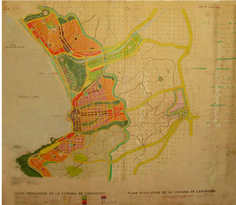
Fig. 2. Proyecto de Plan Regulador de la Comuna de Cartagena 1976, DEPUR, FAU, U. de Chile no realizado.