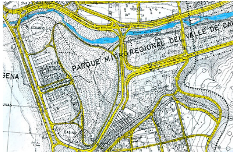
Fig.3. Proyecto de Plan Regulador de la Comuna de Cartagena 1976, DEPUR, FAU, U. de Chile no realizado. Detalle de Zona "Parque Micro Regional del Valle de Cartagena", rematando en el "Camino de las Playas" y el "Paseo de las Dunas".