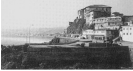
Figs.9, 10 y 11. Vistas de Cartagena. Década de 1990.