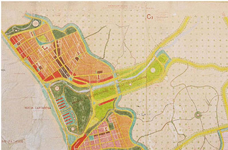
Fig. 6. Zona Norte con Nueva Cartagena.