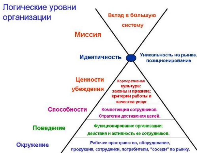
Рис. 1. Модель «Логические уровни организации»

Главная задача модели «Логических уровней организации» – дать управленцу ключи к изменениям в компании.