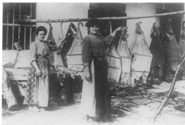
Foto 1.— Secadero de «pinpinuak» en Hondarribi a primeros de siglo.

La conservación de «pinpinuak» se hacía hendiendo el pez a lo largo del dorso, al revés de como se hacía con los bacalaos y, una vez bien abierto, eventrado y sin la espina dorsal, se abandonaba al aire, teniendo la precaución previa de extender bien su cuerpo gracias a trozos de caña o palos apuntados que se colocaban atravesados a lo ancho del pez (Foto 1.). Para cocinarlos se acostumbraba remojar sus trozos unas horas, y luego se cocían, generalmente con patatas y aceite, siendo plato muy apreciado entre gentes de mar, hoy casi olvidado.