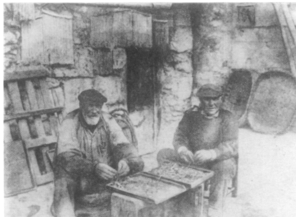
Foto 2.— Cebando «tretzak» en Lekeitio, a fines del siglo pasado.

Los pequeños palangres, o «garbiako-tretzak», fueron muy conocidos y utilizados en aguas someras y fondos limpios de rocas de menos de 25 brazas, pero también en zonas de playas y roquedo inundables durante la pleamar, para lo que se fijaban a estacas clavadas en el fondo. No tuvieron valor económico y las especies que capturaban se destinaban al consumo en los mercados locales. Se elaboraban con materiales baratos y anzuelos de poca talla, y trabajaban con ellos principalmente los pescadores entrados en años (Foto 2).