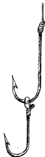
Fig. 3.— Montura doble para «kordela» de merluzas

La única diferencia de esta pesca con la del besugo estaba en las dimensiones de los anzuelos (60 mm. de largo, por 25 mm. de ancho y 2.7 mm. de calibre), y en que su montura en las «kordelas», que a veces era doble, al menos a principios de este siglo, lo armaba un anzuelo como el citado y, colgando de su seno, otro menor guarnecido con una gaza (Fig. 3), quedando uno sobre el otro y cebando generalmente ambos con trozos alargados de jibia o pota y anchoas o sardinas, pulpos o muergos. La pesca solía variar en profundidad, según la estación; siempre mayor en los meses fríos que en el estío. Los lastres, primero de piedra, se construyeron luego de plomo, pero nunca atravesados por la línea, como actualmente, sino pendientes de un corto cabo