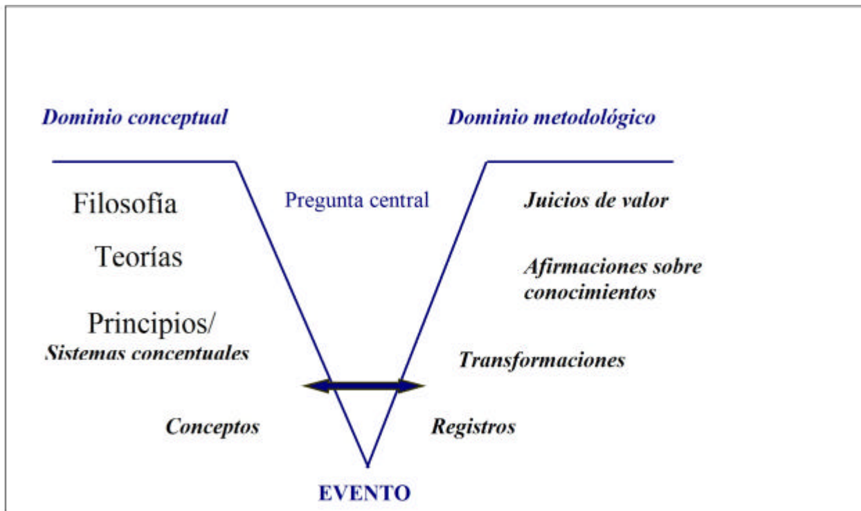
Figura 1: La V de Gowin

A modo de introducción, se presenta un esquema simplificado del diagrama V en el que se puede empezar a discutir los elementos presentes.