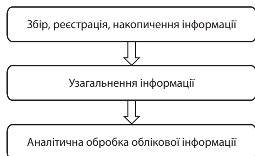
Рис. 1. Схема процесу обліково-аналітичного забезпечення

Обліково-аналітичне забезпечення управління діяльністю підприємства є ширшим за поняття обліково-аналітичної інформації. Слово «забезпечення» у даному терміні означає виконання процесу постачання обліково-аналітичної інформації в систему управління. Це поняття має включати комплекс дій з підготовки обліково-аналітичної інформації (рис. 1).