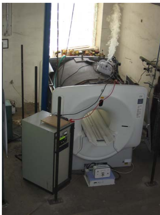
Obr. 4. Zapojenie výstupných veličín ( U , I ) na svorkách supravodivého magnetu počas jeho vybíjania v závislosti na čase. Fig. 4. Current and voltage on magnet terminals during the coil discharge.

Samotné uzavretie magnetického toku v sústave bolo spôsobené vypnutím ohrevu supravodivej spojky magnetu. Na obr. 4 je znázornená celá experimentálna sústava počas prebiehajúceho experimentu, konkrétne počas vybíjania akumulovanej energie do záťaže. Prechod sústavy z tzv. bypass stavu do režimu vybíjania sa bol takisto uskutočnený manipuláciou s ohrevom supravodivej spojky magnetu, v prípade vybíjania sa konkrétne jeho opätovným spustením. Na obr.5 je znázornený približný priebeh výstupných veličín na svorkách supravodivého magnetu počas vybíjania naakumulovanej energie do testovacej záťaže.