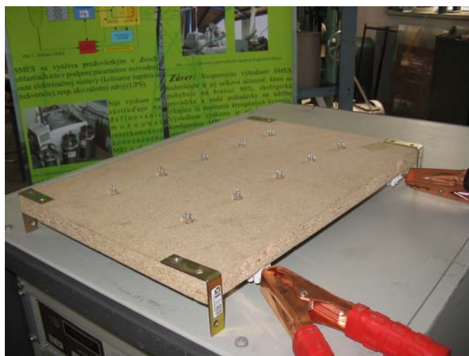
Obr. 1. Testovacia zát'áž pre supravodivý magnet.

Pre prvé experimentálne pokusy vyvedenia elektrickej energie naakumulovanej v magnetickej sústave supravodivého magnetu bola zvolená ako vhodná alternatíva sústava halogénových žiaroviek, ktorá by zároveň vhodne aj opticky demonštrovala vybíjanie sa akumulovanej energie. Dimenzovanie a zapojenie tejto sústavy bolo založené na základe stanoveného limitného, resp. cieľového elektrického prúdu s hodnotou I_{\max}=100 A. Na základe tejto limitnej hodnoty bola zvolená sústava desiatich paralelne zapojených žiaroviek s nominálnym napätím U_{\text{nom}}=6 V a s nominálnym výkonom P_{\text{nom}}=55 W, ktorá je znázornená na obr. 1.