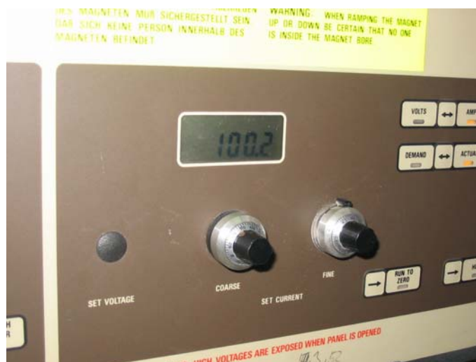
Obr. 3. Horná hranica prúdu externého zdroja. Fig. 3. The current reading of external power supply.

Nabudenie magnetickej sústavy supravodivého magnetu bolo uskutočnené automatickým externým regulovateľným zdrojom jednosmerného elektrického prúdu. Ako už bolo vyššie spomenuté, limitný prúd pri prvom experimente dosahoval hodnotu 100 A, (obr. 3). Aby bolo vôbec možné magnetickú sústavu nabudiť a následne v nej aj tok prúdu uzatvoriť, bolo nevyhnutné zostrojiť stabilizovaný zdroj napätia pre hodnotu stanovenú podľa výpočtov na 18,5 V, potrebných pre napájanie ohrievača supravodivej spojky magnetu. Samotné nabudenie magnetickej sústavy na limitnú hodnotu trvalo cca 60 s.