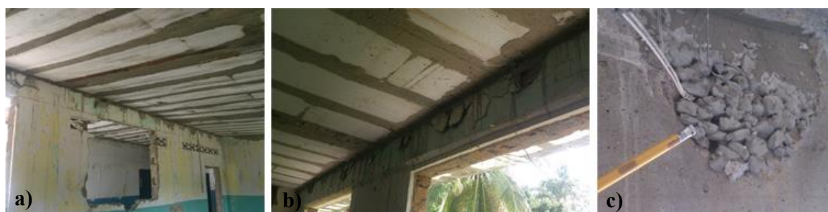
Figura 6. a) Apariencia de la Losa nervada colocada recientemente, b) Agrietamiento generalizado de la viga en la Losa nervada colocada recientemente, c) Práctica inadecuada de relleno de oquedades

estructura donde se ubican las aulas no presentan casi daños con motivo a esa intervención, solo casos muy puntuales de dos columnas donde se evidenció una posible falla por corrosión (columna A'-13) y otra que presentó fisuras características por acción de un sismo (columna A'-12). En ese mismo módulo se observó en las losas de piso de todos los salones fisuras probablemente se deban a la retracción del concreto al momento del vaciado, ya que no se aprecian juntas en las mismas, siendo esto una práctica perjudicial ya que no se da control a las deformaciones plásticas del concreto durante su proceso de fraguado. A continuación, se presentarán imágenes que dan cuenta de manera general del estado del módulo 1 que se encuentra en remodelación (ver Figura 6)