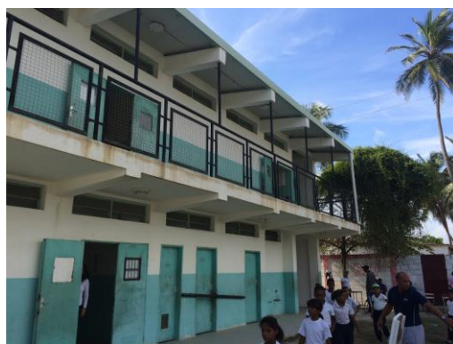
Figura 1. Fachada Lateral Módulo 5 Unidad Educativa Escuela Básica Bolivariana Próspero Agustín Ocando. El módulo 3 construido en el 2003 es una estructura cuyo techo está adosado sobre los módulos 1 y 2. El módulo 4 ejecutado en 1988 era el comedor que dejó de usarse en el 2012, sufriendo intervenciones como demolición de losa de piso, paredes y ventanas. A continuación, se presentan imágenes en las Figura 2 correspondientes a las fallas observadas.

En la Figura 1 se aprecia la fachada lateral de uno de los módulos de la Unidad Educativa. Entre las principales fallas observadas en la edificación se encontró: humedad y eflorescencias, grietas, fisuras, pérdida de recubrimiento de concreto, exposición y delaminación del acero en el concreto. Con respecto a los módulos 1 y 2, fueron construidos en 1967 siendo de mampostería confinada y dejó de usarse en el año 2000, realizándose diversas intervenciones desorganizadas como: demoliciones de losa de piso, modificación de las puertas y sus alturas, construcción de paredes divisorias que lo han afectado en su estabilidad.