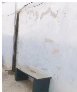
Figura 8. Humedad de las paredes de la escuela Bolivariana Lizardo

La edificación se construyó hace 9 años, en el Sector Lizardo, calle principal del Municipio José Laurencio Silva y se dividió en 4 módulos para hacer el levantamiento. Se observaron las siguientes fallas particularmente, manchas de humedad, presencia de hongos, exposición del acero de refuerzo e intervenciones anteriores no culminadas. En la Figura 8 se aprecia la presencia de humedad.