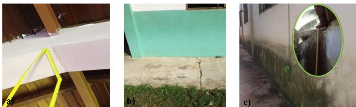
Figura 4. Fallas observadas: a) Presencia de grieta transversal inferior en la viga de carga del techo, b) Grieta transversal en la losa de piso perimetral, c) Presencia de humedades en color oscuro en paredes perimetrales

Considerando los resultados del análisis de la estructura, se evidenció, la falla que más surge es la de rajaduras por orígenes estructurales con 45,59%, debida principalmente a movimientos del suelo de fundación, por ello se recomienda la realización de un estudio de suelo exhaustivo en la zona, que permita determinar con certeza cuales son los movimientos