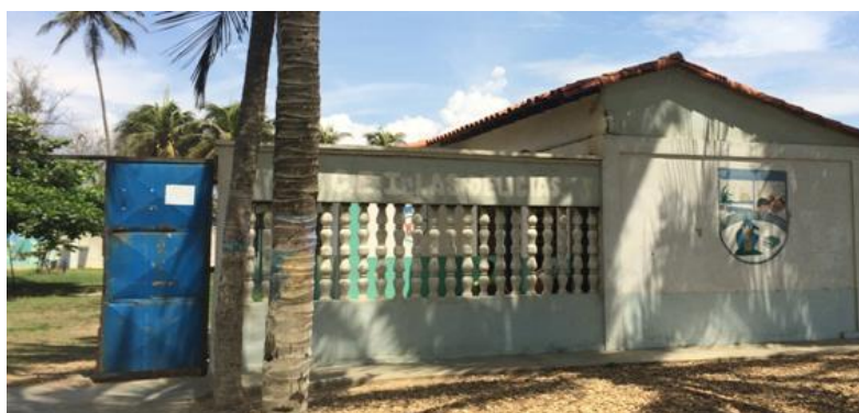
Figura 3. Fachada principal de la Unidad Educativa Las Delicias

En la Figura 3 se observa la fachada principal de la Unidad Educativa Las Delicias. Las principales fallas observadas durante la inspección fueron: humedad en las paredes perimetrales, grietas y fisuras de elementos estructurales, eflorescencias en la parte inferior de las paredes. Resalta un desprendimiento del concreto por corrosión acero en la fachada principal en la columna B-11, sobre la cual se debe intervenir ya que su distancia a la costa es menos de 50,00 m. Se presentan seguidamente imágenes que representan las fallas que se mencionadas (ver Figura 4). En esta institución no se realizaron ensayos sobre los elementos estructurales.