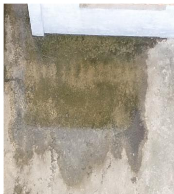
Figura 9. Acumulación del agua en el borde de la acera del módulo 3

En resumen lo que se observa es principalmente el estancamiento de agua, falla en drenajes, y manchas de humedad y hongos. Por lo tanto, se recomienda realizar labores de mantenimiento y limpieza que permitan que la basura no se acumule en la tanquilla del alcantarillado, ya que en la época de lluvia se presentara una inundación localizada muy perjudicial para los cerramientos, así mismo sería conveniente corregir la pendiente invertida de la acera perimetral del módulo 2.