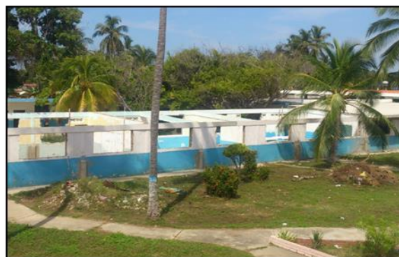
Figura 5. Fachada del Liceo Próspero Agustín Ocando

El Liceo Bolivariano Próspero Agustín Ocando, ubicado en el municipio Silva, en la población de Boca de Aroa, sector Las Delicias, se encuentra a 270,00 m de la línea costera. En la Figura 5 se puede apreciar la fachada de uno de los módulos. Este liceo aun cuando está en un ambiente altamente corrosivo, algunas fallas presentadas no tienen como origen la corrosión, esto se puede asegurar debido a las características que presentan las fisuras de los elementos estructurales estudiados. Esta estructura ha sido vulnerada por los procedimientos constructivos empleados, se puede apreciar que la mayoría de fisuras se presentan en elementos secundarios como cerramientos y la losa de piso del ala oeste de la edificación.