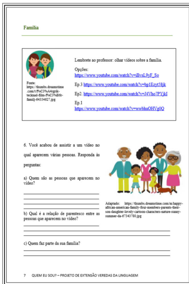
Figura 2 -Exemplo de atividade desenvolvida

Nessa unidade são abordadas, também, as nacionalidades, através da exploração de mapas e bandeiras de países. Nessa etapa, as atividades escritas são mais lúdicas, como palavras cruzadas, por exemplo. A ideia é que se explore oralmente essa temática, fazendo com que os alunos digam aos colegas qual a sua nacionalidade (em português).