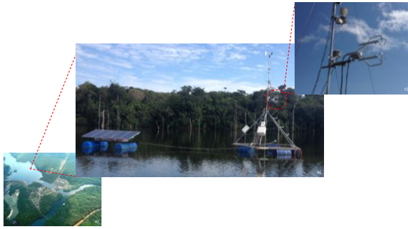
Figura 1 - Localização da Usina Hidrelétrica de Curuá-Una, na cidade de Santarém – Pa (Figura A). Na Figura B temos a estrutura flutuante instrumentada com o sistema de fluxo e o flutuante de alimentação com painéis solares na Figura C