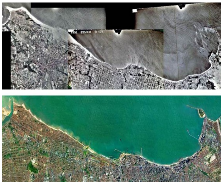
Figura 7 – Perfil comparativo do ambiente costeiro em Fortaleza nas décadas de 1950 (acima) e na atualidade (abaixo).

Com a decadência da Praia de Iracema, em meados da década de 1950, favorecida pela ação erosiva e a consequente instalação de quebra-mares (ver Figura 7), e do Centro da cidade, devido a mesma ter ficado a margem do processo de expansão urbana que Fortaleza vinha passando nesses últimos decênios, registrando desvantagens locais de grande porte e acentuado isolamento do restante da cidade.