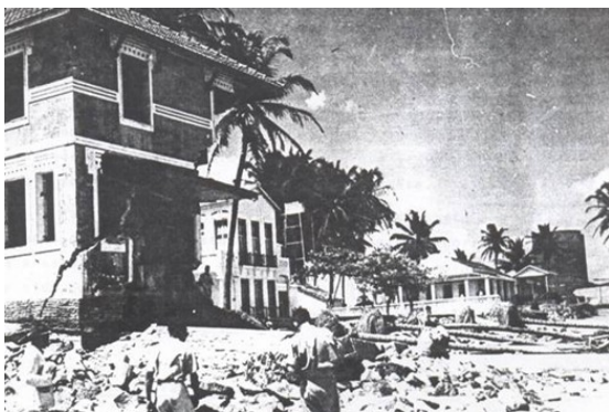
Figura 5 – Destruição da área próxima ao restaurante Estoril-1955.

Porém, o uso da Praia de Iracema para as práticas marítimas é efêmero, pois com a transferência do Porto do Poço das Dragas para o Mucuripe, além de resultar no abandono e consequente deterioração dos armazéns das Dragas, provocou uma série de problemas ambientais, tendo a área preferencial para banho na Praia de Iracema sendo violentamente atingida pela corrente da costa, resultando na erosão da praia. A privilegiada paisagem praiana é destruída (Figura 5), resultando apenas pequenos trechos da praia com balneabilidade.