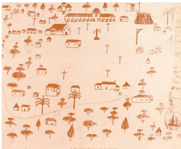
Figura 1 - Primeira Planta da cidade de Fortaleza (1726).

Essa precariedade infraestrutural de Fortaleza é percebida a partir da análise da Primeira Planta da Cidade de Fortaleza, rascunhada em 1726 por Manuel Francês (Figura 1) que apresenta a Fortaleza do início do século XVIII.