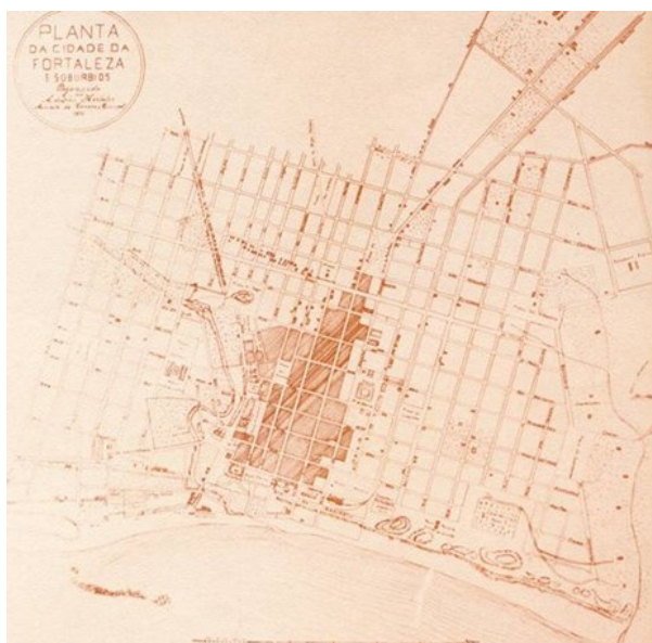
Figura 4 – Planta Topográfica de Fortaleza e Subúrbios (1875).

Percebe-se o incremento de equipamentos urbanos em Fortaleza, como a construção de um novo cemitério, a criação da Academia Francesa, a iluminação a gás carbono, entre outros. Surge também a Planta Topográfica de Fortaleza e Subúrbios (Figura 4), de autoria do engenheiro Adolfo Herbster. Integrante da diretoria de obras de Pernambuco, Herbster é cedido ao Governo Provincial do Ceará em 1855, sendo contratado pela municipalidade fortalezense. Dois anos depois, sendo solicitado para a elaboração de plantas da cidade. O urbanista traça um plano urbanístico de desenvolvimento para a cidade, dado pela necessidade de expansão àquela época, devida o aumento de sua população 2 .