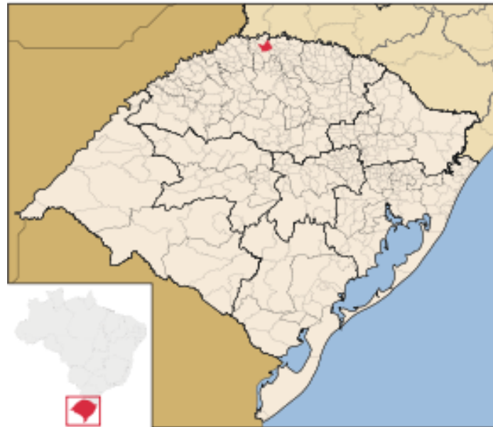
Figura 1: Município de Frederico Westphalen.