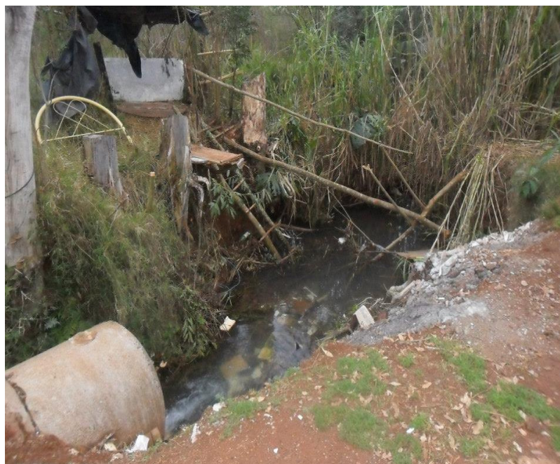
Figura 8: Desembocadura do curso d'água.

O curso d'água, foi canalizado por uma tubulação e desemboca em um bueiro juntamente com a nascente 1 (Figura 7).