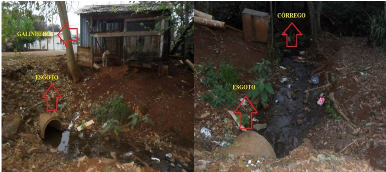
Figura 9: Poluição do curso d'água.

Na sequência este duto junto com a drenagem superficial é desaguado em um pequeno córrego, onde pode-se observar descaso por parte da população, muita disposição de resíduos no local, criação de animais próximo ao curso d'água, com lançamento direto de dejetos no mesmo. Mais a frente, encontrou-se tubulações de esgoto residencial, também despejados no mesmo, conforme a figura 9 a seguir.