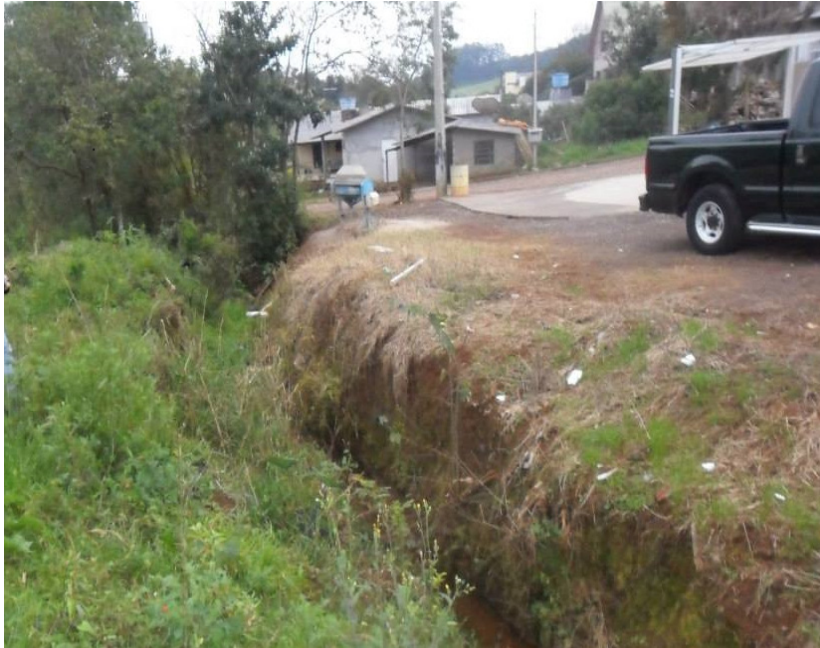
Figura 5: Moradias em locais inadequados.

Além disso, observou-se que a área apresenta problemas como o solo descoberto, falta de vegetação marginal onde há residências nas proximidades do local (Figura 5), o que não está de acordo com as conformidades da lei. Segundo o Novo Código Florestal – Lei nº 12.651, de 25 de maio de 2012: