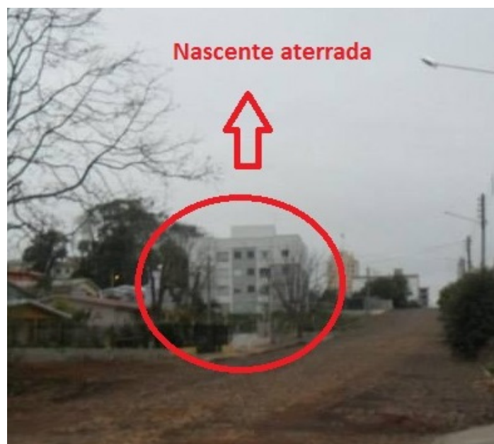
Figura 6: Nascente 2.

IV - as áreas no entorno das nascentes e dos olhos d'água, qualquer que seja a sua situação topográfica, no raio mínimo de 50 (cinquenta) metros [...].