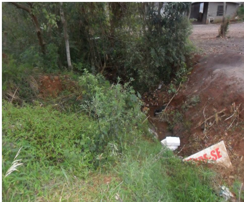
Figura 4: Disposição de resíduos.

No decorrer do curso d'água, observa-se disposição de resíduos domiciliares, de construção civil, incluindo materiais de difícil degradação como: sacos e copos plásticos, latas de alumínio, isopor, entre outros (Figura 4).