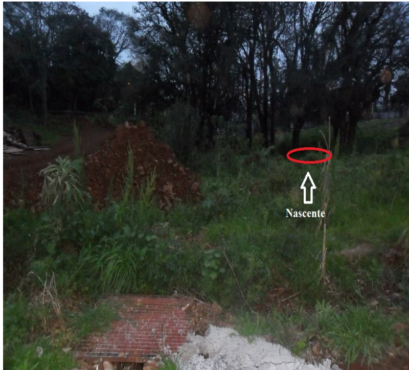
Figura 3: Nascente 1.

Realizou-se uma visita à área de estudo para o reconhecimento e análise do local. Onde pode-se perceber a presença de vários agentes impactantes, degradação e descaso da população com o curso d'água e também com as duas nascentes.