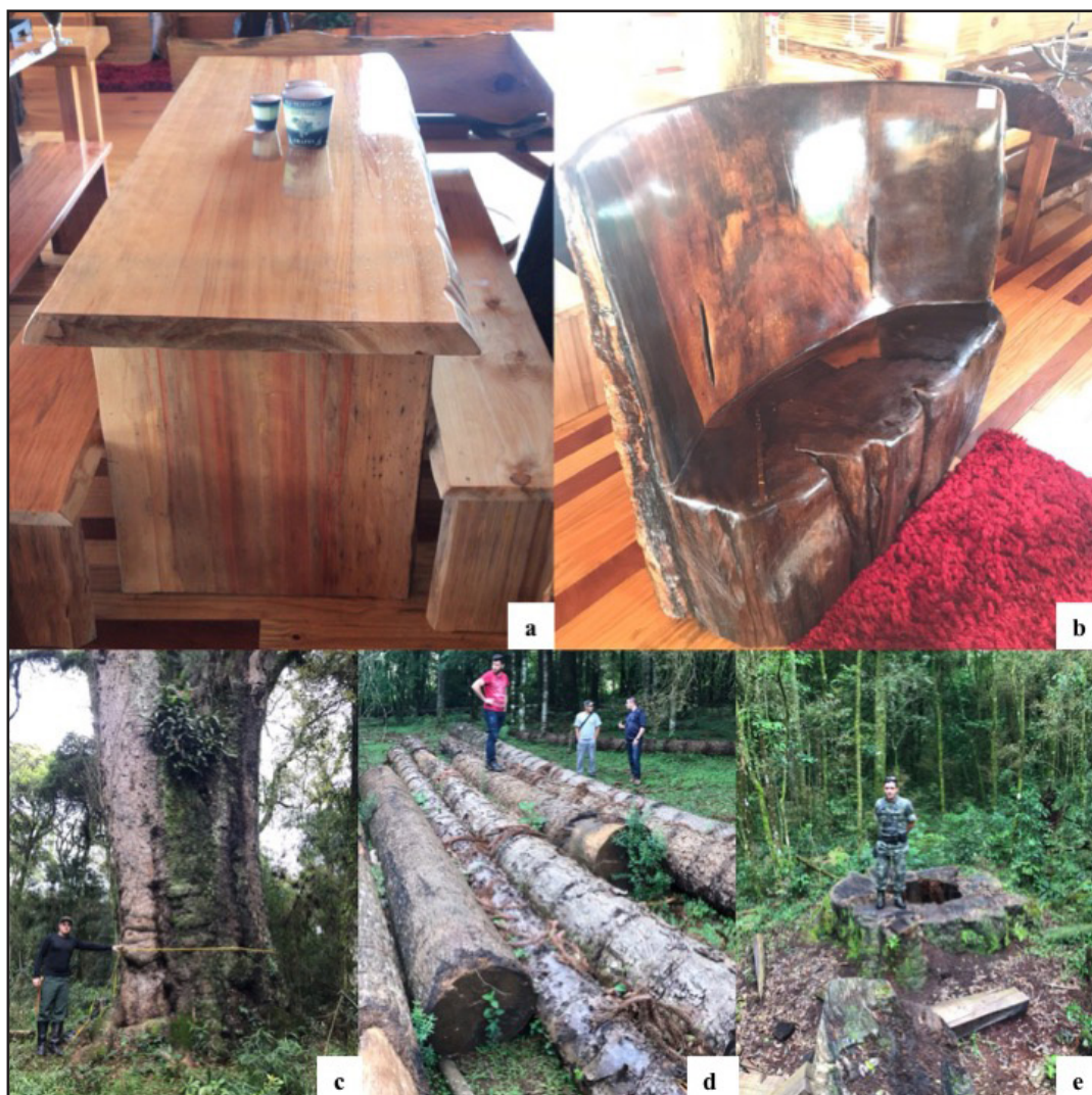
Figure 5 – Furniture made from trunks of centenarian individuals of Araucaria angustifolia (a) and Ocotea porosa (b) marketed at the Armazém da Madeira in Catanduvas, SC ; trunk of Ocotea porosa (c), 2.74 m of DHB in Vargem Bonita, SC; (d - e) logging of araucaria and giant imbuia trees in Catanduvas, SC state.