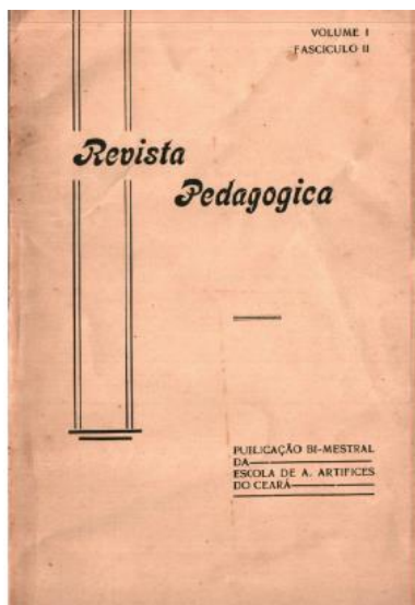
Figura 2: Capa da Revista Pedagógica (1917)