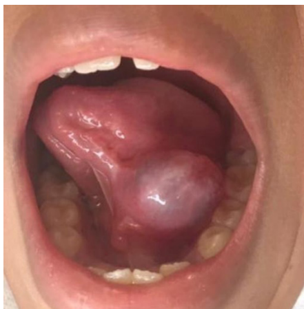
Figura 1 - Aspecto inicial intraoral da lesão na anamnese

Ao exame extraoral, observou-se dificuldade de selamento do lábio inferior por conta da posição da lesão com aspecto de bolha, conteúdo cristalino, de cerca de 3,0 cm em seu maior diâmetro, assintomática, flutuante à palpação e recoberta por mucosa. Intraoralmente, o menor estava em fase de dentição mista, com diagnóstico ortodôntico classe I de Angle, com ausência de lesões de cáries nas superfícies dentárias, baixo risco de cárie, higiene satisfatória e diário alimentar de risco cariogênico (figura 1).