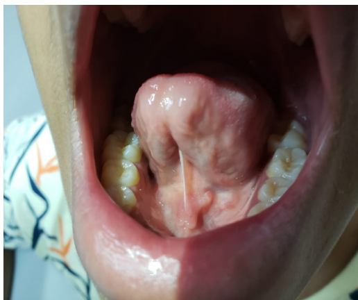
Figura 4 - Pós-operatório depois de seis meses

Após sete dias, o paciente retornou sem intercorrências, com vedamento de lábio inferior. Com a finalidade de preservação, ele voltou à clínica, também sem intercorrências, depois de seis meses do procedimento cirúrgico (figura 4).