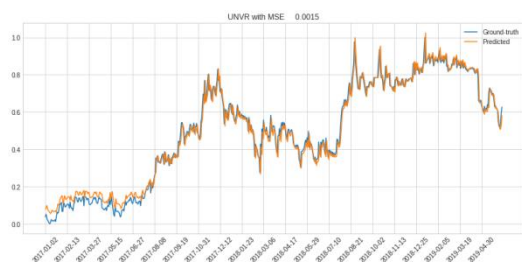
Gambar 3. Hasil prediksi harga saham dengan LSTM

training 18.2s dengan hasil MSE sebesar 0.0015. Berikut ini adalah perbandingan grafik data asli dengan grafik data prediksi.