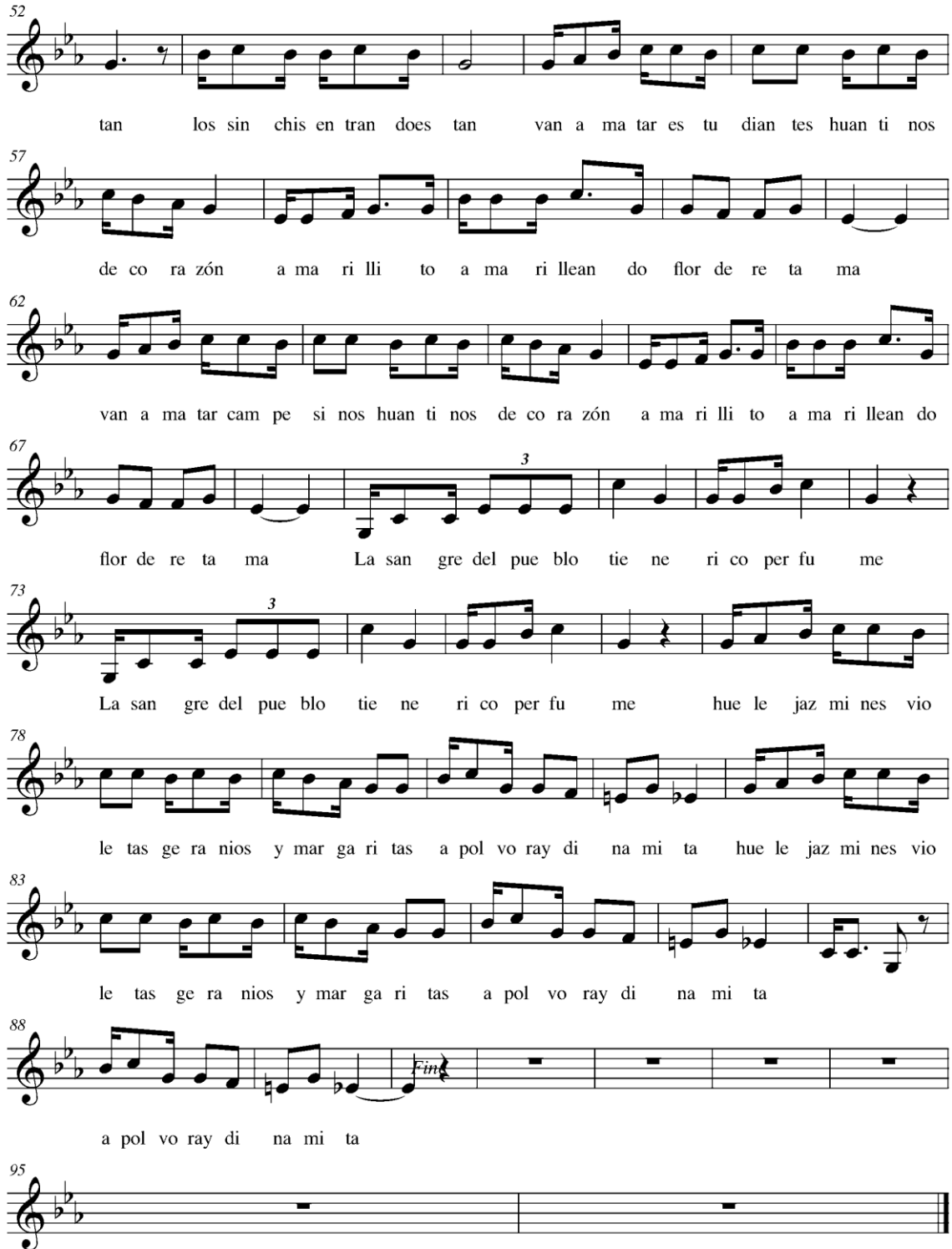
Ejemplo musical 2: "Flor de retama"