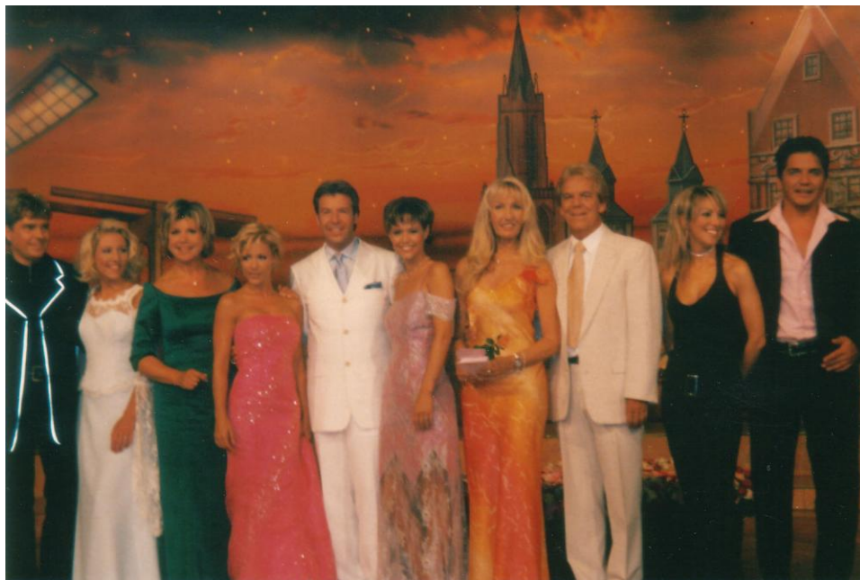
Gráfico 3: Frank Schöbel (primero a izquierda) en un concierto de Schlager en Maastricht

El schlager alemán “ Wir brauchen keine Lügen mehr ” (No necesitamos más mentiras) del popular cantante de la desaparecida República Democrática Alemana Frank Schöbel, sufrió transformaciones bastante parecidas (comunicación personal de Schöbel; Schöbel 1998: 532-559). Editada en el contexto político inmediato a la caída del muro de Berlín, en 1989, esta simple balada romántica en modo menor con fondo orquestal, devino, incluso contra la voluntad del intérprete, en un lema político contra el régimen socialista (véase el texto). Inmediatamente tras su aparición “ Wir brauchen keine Lügen mehr ” provocó una serie de reacciones por parte del gobierno debido a las implicaciones políticas que de forma soterrada permitía el título. Mas todos los intentos por acallarla fueron en vano. La canción caló hondo. Meses más tarde, cuando Frank Schöbel la interpretó en el Palacio de la República durante las celebraciones por la centésima transmisión del programa televisivo Ein Kessel Bunes —el programa de mayor audiencia en la RDA—, nadie la tomaba más por una inocente canción de amor, ni siquiera Schöbel, quien entretanto también se valía de ella para expresar su inconformidad con la situación en la RDA. “ Wir brauchen keine Lügen mehr ” se convirtió así en un símbolo de la resistencia democrática y por consiguiente fue entonada por las masas el 9 de noviembre de ese año, mientras caía el muro de Berlín y se abría la frontera entre las dos Alemanias.