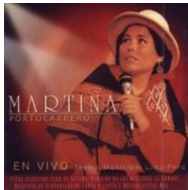
Gráfico 2: Carátula del disco Martina Portocarrero en vivo de la década de 1980

“Flor de retama” (versión de Martina Portocarrero)