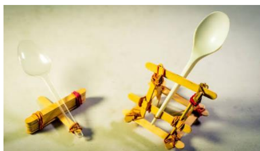
Gambar 7. Salah satu ketapel karya siswa

Langkah 5. Setelah siswa mendesain kemudian mengujikan ketapel masing-masing di depan secara bersama-sama, secara tidak langsung siswa telah membuat sebuah hasil karya. Dimana karya atau produk tersebut adalah sebuah ketapel yang dapat melambung 2 meter dengan ketinggian tertentu dalam 30 kali percobaan. Dalam permainan atau pengujian ketapel ini yang paling banyak peluang kemungkinan terjadinya sebuah peristiwa selama 30 kali menjadi pemenang pengujian ketapel. Gambar 7 merupakan salah satu contoh hasil karya siswa dengan membuat ketapel.