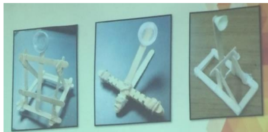
Gambar 5. Contoh Ketapel dengan Berbagai Model

Langkah 2. Guru memberi berbagai contoh macam gambaran ketapel yang hendak dibuat oleh siswa sehingga bola ping pong dapat melambung atau menembak sejauh 2 meter. Namun, sebelumnya guru menginstruksikan atau memberi ilustrasi terhadap siswa agar tertanam konsep yang diharapkan. Gambar 5 merupakan contoh ketapel yang diberikan guru kepada siswa.