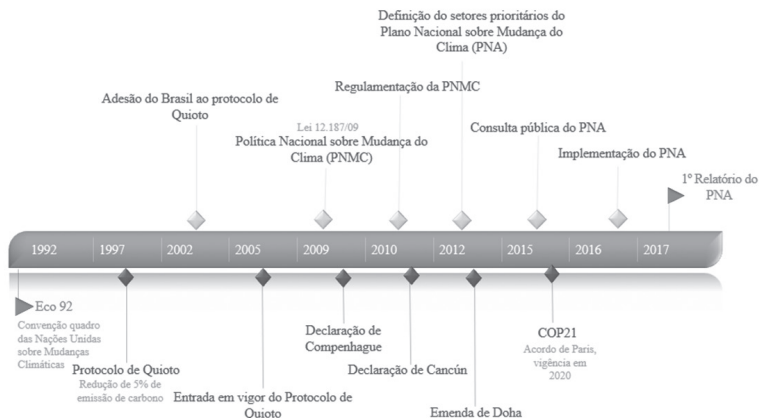
Figura 3 – Linhas temporais associadas às principais políticas de adaptação às alterações climáticas no direito internacional e no direito brasileiro

A análise comparativa da linha temporal associada à Política Nacional sobre Mudança do Clima, com a linha temporal associada à Convenção-Quadro das Nações Unidas sobre Mudança do Clima, representadas na Figura 3, mostra o processo comparado da criação de instrumentos internacionais e a internalização por meio de legislações no contexto brasileiro.