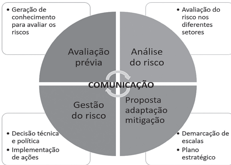
Figura 1 – Modelo de gestão do risco

Fonte: Adptado de Tavares (2013, p. 70) 1