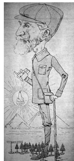
Fig. 1 Il «viaggiatore impenitente», caricatura di Charles Buls pubblicata in «Le Grincheux», 1 gennaio 1911. «Sa mince silhouette, grave et austère, plusieurs fois synthétisée sous les traits de Don Quichotte ou du voyageur impénitent, a toujours, même sous le crayon des caricaturistes, attesté la constance de son enthousiasme pour le beau et le vrai [...]». Da M. Martens, Charles Buls... cit., p. 72.

Tra il 1906 e il 1907, giunto ancora una volta in Italia dopo alcuni mesi a Bruxelles, è di nuovo in Liguria, e poi a Lucca, Firenze, Vetulonia (dove assiste agli scavi in compagnia di Isidoro Falchi) 15 , Perugia, Bologna e Roma, qui ospite fisso alla Biblioteca di San Lu-