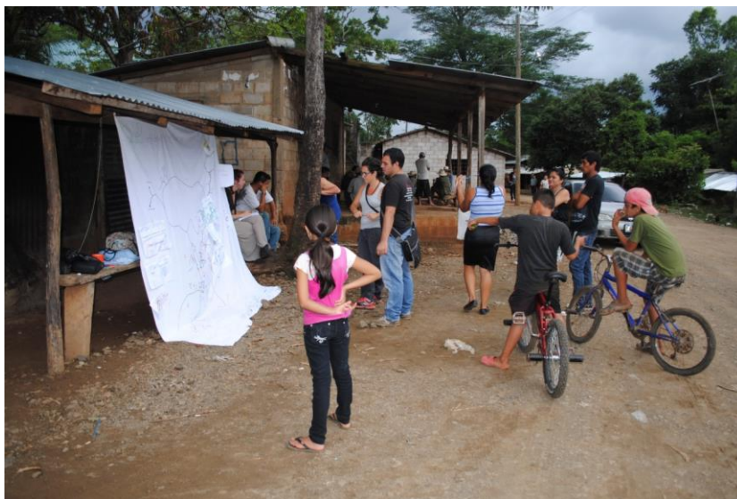
Fig.1 - Mappe informali per l'informazione comunitaria