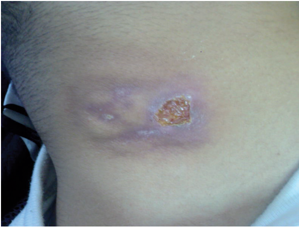
Resim 1. Hastanın boyun bölgesindeki tanımlanan lezyonu

Biyopsi materyalinin histopatolojik incelemesinde ülser alanlar yanında çok katlı yassı epitel altında langhans tipi dev hücreler, epitelooid histiyositler ve çevresinde lenfositlerden oluşan granülom yapıları, stromada polimorf nüveli lökositler içeren iltihabi infiltrasyon ve damarlanmada artış görüldü (Resim 2). Ziehl-Neelson histokimyasal boyamasında basil gösterilemeyen hastaya skrofuloderma tanısı konuldu. Hastanın çocuk islahevinde kalıyor olması nedeniyle verem savaş dispanserine haber verilerek kaldığı ortamda tüberküloz taramasının yapılması sağlandı. Hastanın sonraki takip ve tedavisinin dispanser gözetiminde devamı planlandı.