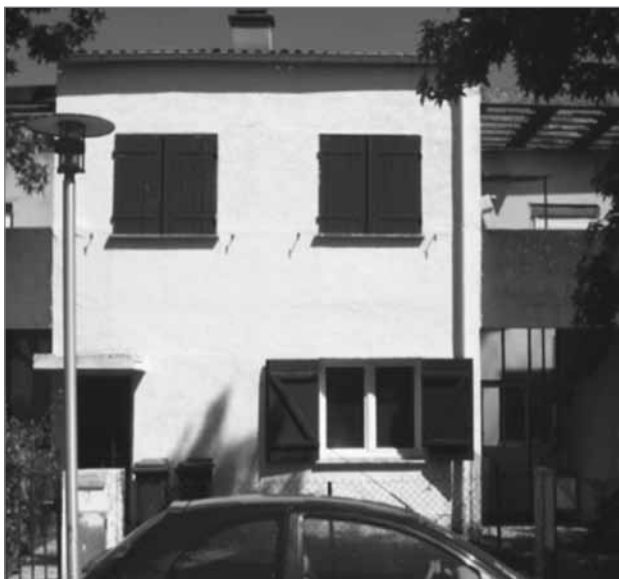
Slika 5: Pessac zdaj – bodite pozorni na spremembe, ki so jih naredili prebivalci

kami »navadne ljudi razsvetlil«. Leta 1930 je dobil priložnost, da v kraju Pessac (sliki 4 in 5) zgradi 130 hiš za delavce nekega tovarnarja. Vendar prebivalci niso razumeli ubrane rabe prostorov in barv. Svoje »machines à habiter« so kmalu spremenili tako, da so ustrezali njihovim potrebam. To ponazarja razkorak med mislimi tako imenovanih strokovnjakov in zamislivi ljudi, ki so jim ti načrti namenjeni.