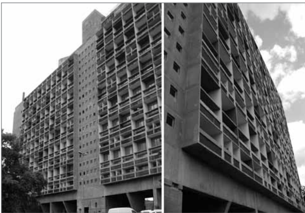
Slika 1: Le Corbusierjeva Unité d'habitation, Firmini

Marseille, maj 2006. Ko smo se približevali Cité Radieuse , Le Corbusierjevi modernistični mojstrovini, orjaškemu sivemu stanovanjskemu bloku na stebrih (slika 1), sva nekega študenta vprašala, kaj mu je ob pogledu na mogočno zgradbo najprej prišlo na misel. Mladenič, ki je bil doma iz enega od najbolj podeželskih območij v Flandriji v Belgiji, je odgovoril: »Spominja me na kletke za baterijsko rejo.« Dan pozneje so se študentje, ki so hodili pred nama, nenadoma ustavili in niso hoteli naprej do enega izmed naselij s socialnimi stanovanji v severnem predmestju Marseilla. Ožgana pročelja in staljeni asfalt so pričali o nasilnih spopadih. Še bolj jih je prestrašila izjava hotelske receptorke. Zatrjevala je, da so severna predmestja veliko prenevarna, da bi jih obiskali, in nas prepričevala, naj ne gremo tja.