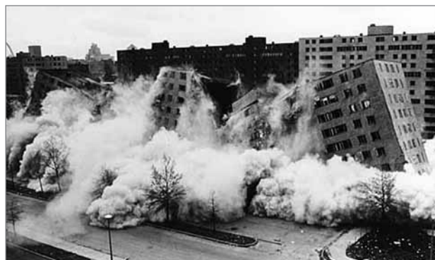
Slika 3: Naselje Pruitt-Igoe – od sanj do rušenja

Vendar je »vsega dobrega« enkrat konec! Van Eyck je že leta 1959 opazil, da so te minimalne stanovanjske oblike »nova vrsta barak« in da je » die Wohnung für das Existenzminimum « postal priročnik za upravnike zgradb in podjetnike, ki jih je zanimal samo donos (Van Eyck, 1959). Vendar to ni preprečilo nadaljnje širitve zamisli pripadnikov kongresa CIAM. Med najzloglasnejšimi naselji je bilo naselje Pruitt-Igoe v St. Louisu v ameriški zvezni državi Misuri. Zgrajeno je bilo v 50. letih prejšnjega stoletja in porušeno že leta 1972 (slika 3). Čeprav obstajajo dokazi o številnih pomembnih načrtovalskih napakah, nekateri še vedno trdijo, da za to ne smemo obtoževati »arhitekture«. Rečemo lahko, da v naselju Pruitt-Igoe ni bila napačna samo arhitektura, tako kot v številnih drugih naseljih, vendar je brez dvoma pomembno prispevala k njegovemu neuspehu. Charles Jencks (1977) je dejal, da je rušitev naselja Pruitt-Igoe označila konec visokega modernizma.