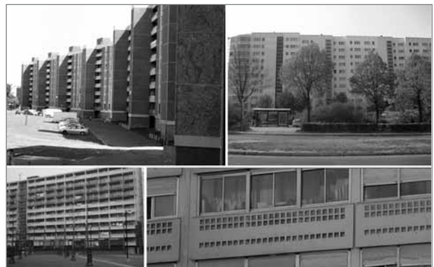
Slika 2: Prenavljanje nebotičniških naselij