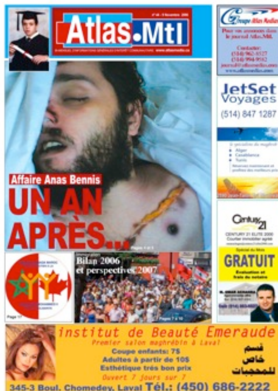
Figure 2: Une du numéro 44, 5 novembre 2006

Ces gros titres sont quelques fois accompagnés tout en bas d'une ou deux publicités, généralement de petites entreprises ou de professionnels d'origine maghrébine. La page 2 contient le sommaire de l'édition. Ensuite, on tombe sur différents articles regroupés par rubriques, telles que: éditorial, droits et libertés, dossier (plusieurs pages sur un même sujet), actualités, communauté, entretiens, solidarité, célébration, immigration, idées, initiatives, développement, débats, chronique, opinion, actes, justice, injustices, sports, culture et spectacles, etc. Les rubriques varient d'une édition à l'autre, et elles évoluent selon les événements, les thèmes abordés et la façon dont on désire les aborder. Quelquefois, on reproduit des articles parus dans les grands médias de masse. Des intellectuels maghrébins sont régulièrement invités à écrire des chroniques. Les publicités sont présentes à chaque page du journal, et certaines occupent une page entière. Ces publicités font surtout de la promotion "communautaire" 4 (entreprises ou professionnels divers: avocats, instructeurs automobile, etc., généralement d'origine maghrébine) ou annoncent des activités (spectacles, célébrations) importantes pour les Maghrébins.