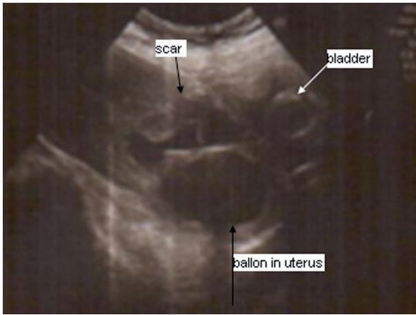
Resim 1. Uterus istmik bölgede sezeryan skar kısmında myometrial devamsızlık izlenmektedir.

normal sınırlarda idi. Hasta sezeryan skar gebeliği ön tanısıyla gerekli bilgilendirme sonrası operasyona alındı. İntraoperatif değerlendirilmede; bilateral adnexler normal izlendi. Uterus eski insizyon skarına uyan bölgeyi örten visseral peritonu disekte edildiğinde; eski insizyon skarından mesane duvar sınırına kadar plasental dokular izlendi (Resim 1). Plasental dokular kürete edilip, eski insizyon skarını sütüre edildi. Postoperatif dördüncü günde beta-hCG düzeyi 156 mIU/ml olarak tespit edilen hasta şifa ile taburcu edildi. Takiblerinde postop ikinci haftada beta-hCG düzeyi <5 mIU/ml olduğu saptandı.