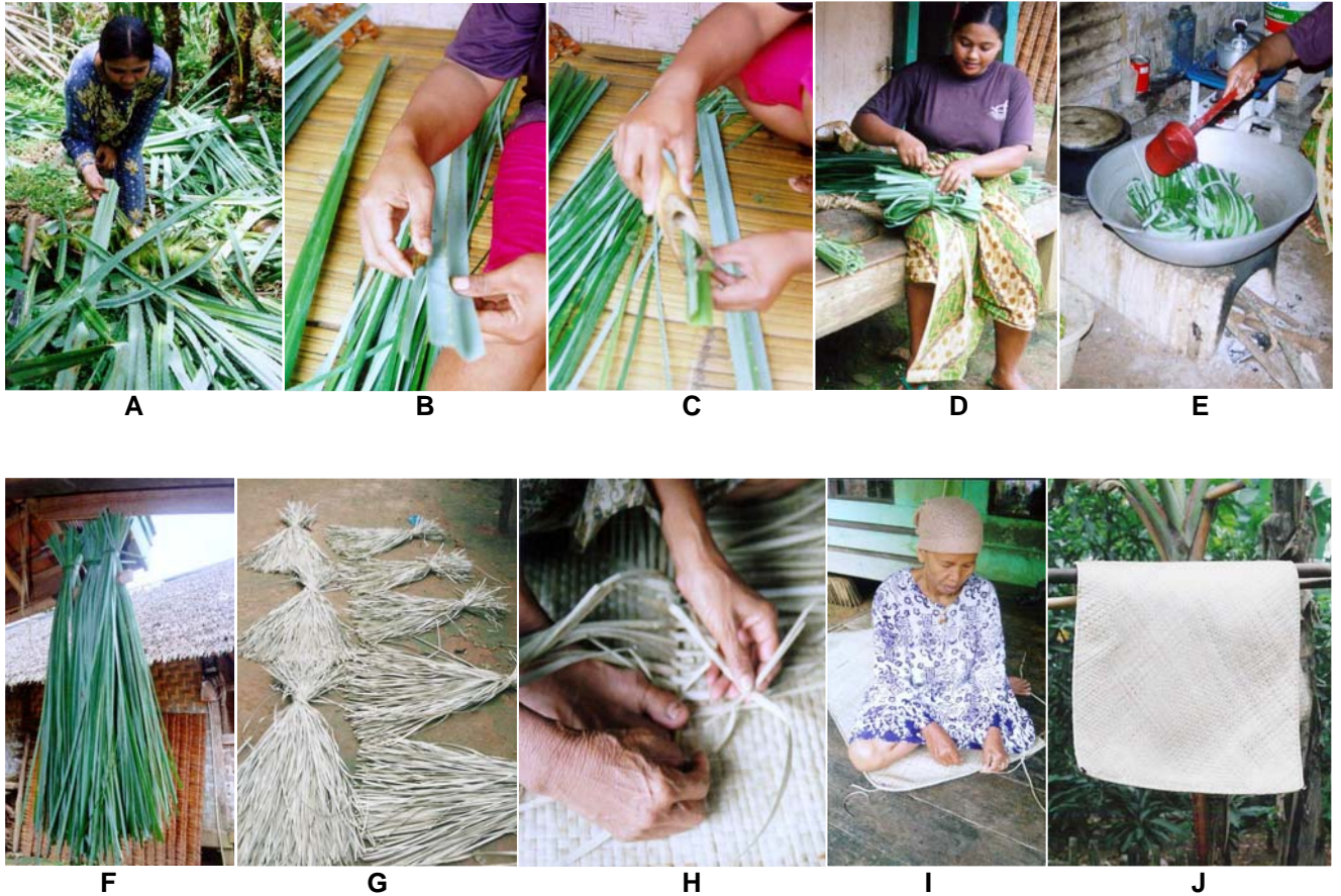
Gambar 3. Tahap-tahap pembuatan bahan anyaman tikar dengan bahan dasar daun P. odoratissimus (A-J).