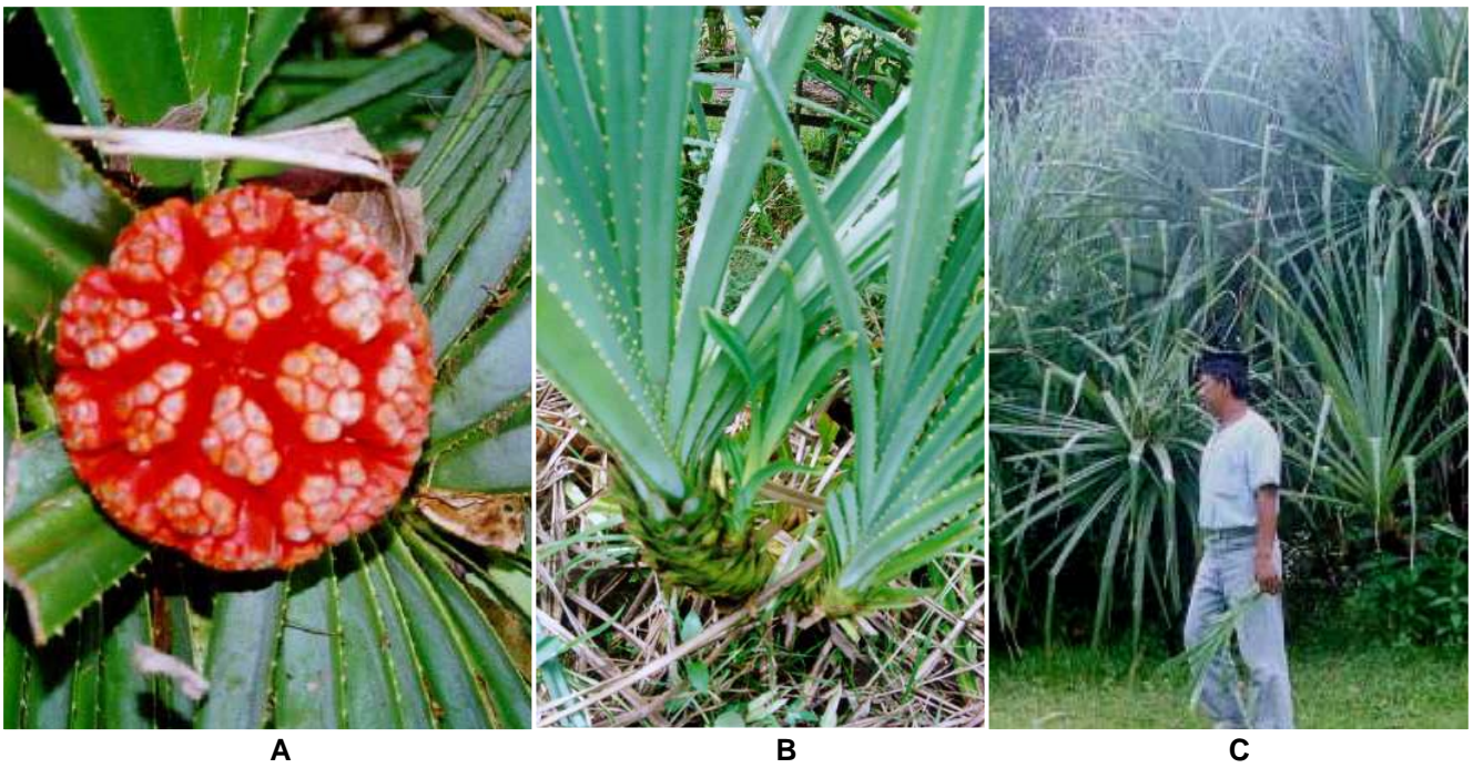
Gambar 2. Pandan samak ( P. odoratissimus ) di Ujung Kulon. A. Struktur cephalium dari P. odoratissimus tampak jelas beserta daun yang berililin putih. B. Anakan atau "sengket". C. Populasi pandan samak yang siap dipanen.