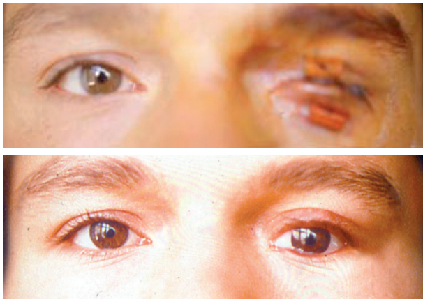
Resim 2a. Postoperatif 1. gündeki görünüm 2b: Protez uygulaması