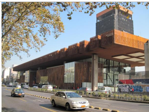
El edificio ex UNCTAD III, hoy Centro Cultural Gabriela Mistral, GAM, recién restaurado, e inaugurado en 2010.