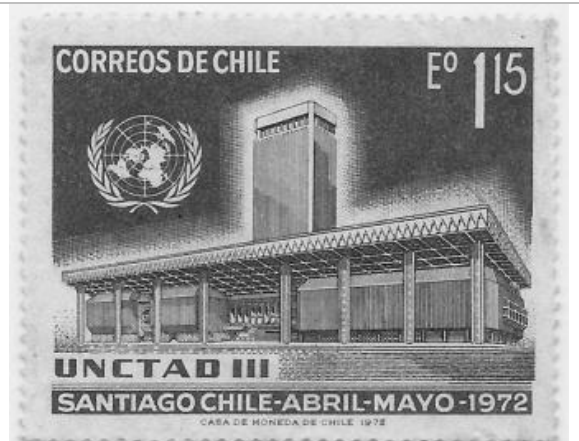
Edificio UNCTAD III en emisión de Correos de Chile.

Podría quizá sonar extraño que en estas notas sobre el concurso del Área Central de Santiago las primeras referencias sean para el edificio de la UNCTAD. Pero lo cierto es que la primera lección importante, que estaba probablemente en la base del concurso