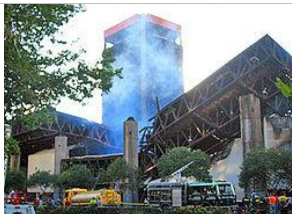
El gran salón plenario, con capacidad para dos mil personas, fue el espacio más afectado por el incendio que el 5 de marzo de 2006 destruyó el sector Oriente del edificio ex UNCTAD III.

y que estuvo en muchas de las polémicas de la teoría arquitectónica de los últimos tiempos, la daba precisamente el conjunto UNCTAD: es posible proponer un edificio-ciudad, es posible modificar la escala tradicional del damero colonial, es posible insertar una estructura de la modernidad y de la socialidad más absoluta, sin perder, más aún revificándolo, todo el sabor de remanso, de escala, de individualidad, de medida, que dan las secuencias de las piazzetas, de las plazas, de las fuentes, de las esculturas de la salida de UNCTAD sobre Villavicencio.