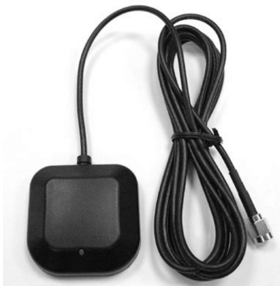
Рис. 2. Зовнішня антена ANT-555 GPS-00464