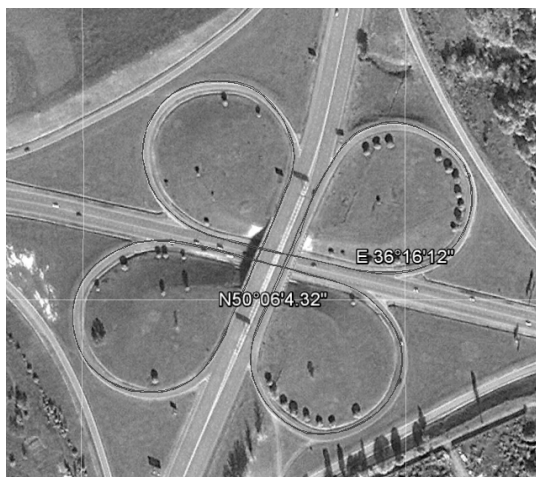
Рис. 3. Зображення траєкторії руху

Тестування працездатності пристрою проводилося на дорозі загального користування зі встановленням обладнання на легковому автомобілі. Місцем проведення тестових заїздів було обрано транспортну розв'язку на перетині Кільцевої дороги та Белгородського шосе. Автомобіль рухався із середньою швидкістю 40,65 км/год по кільцевому маршруту довжиною 1700 м. Для візуальної оцінки форми траєкторії використовувалася ГІС «Google Планета Земля», яка застосовує СК WGS-84 як референтну загальносвітову систему. Для візуалізації зображень використовувалися перетворені просторові дані, перенесені на динамічні шари, відображені накладенням поверх карт відповідної місцевості (рис. 3).