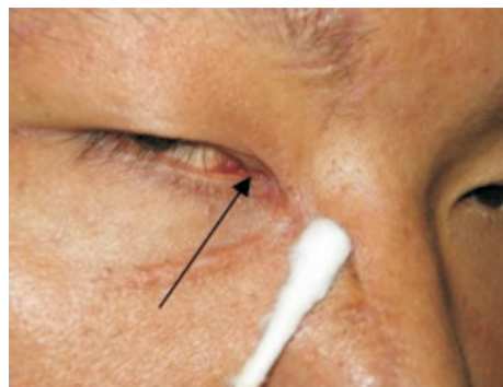
图2 留管期间及拔管后该处结膜均呈小裂隙状。