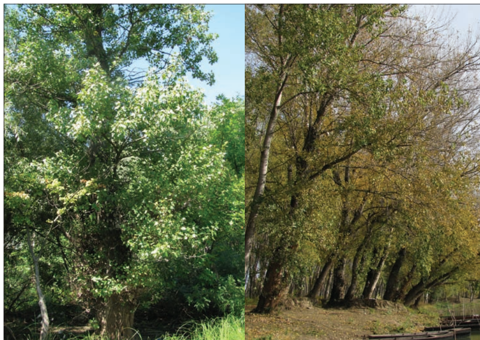
Слика 1. Локалитет Ковин – популација Дунав (лево), Локалитет Бачко Петрово село – популација Тиса (десно)