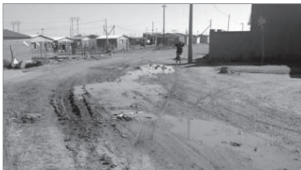
Slika 1: Hiše v žalost zbujujoči soseski naselja Braamfischerville