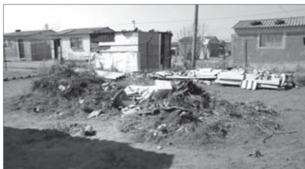
Slika 4: Hiša, ki je pogorela zaradi neustrezne električne napeljave.

Kakovost življenja na preučevanem območju je slaba tudi zaradi omejene velikosti tamkajšnjih stanovanj. Zaradi prevelikega