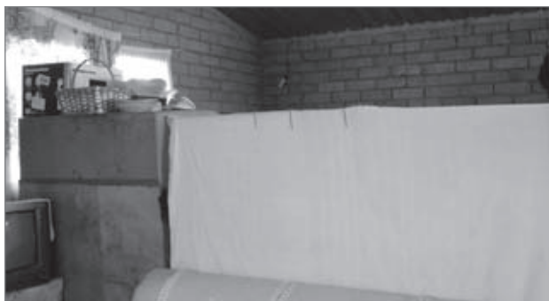
Slika 3: Stanovalci poskušajo ustvariti občutek zasebnosti.

fizičnega in družbenega okolja, kot tudi z njenimi specifičnimi lastnostmi«. Najprej je treba poudariti, da so anketirani stanovalci prvi lastniki, ki so pred tem najverjetneje živeli v barakah ali ilegalno naseljevali tuja dvorišča. Kljub temu je iz povprečnih vrednosti v preglednici 1 razvidno, da je večina nezadovoljnih oziroma zelo nezadovoljnih s svojimi hišami, ki so bile zgrajene v okviru RDP. Če pa upoštevamo njihove odgovore glede zadovoljstva s celotno hišo, jih več kot 50 % navaja, da so z njo zadovoljni oziroma zelo zadovoljni. Velja pa poudariti, da gre za prve lastnike, ki so prej živeli v veliko slabših razmerah.