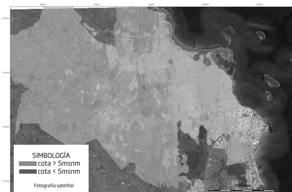
Figura 1. ZONAS BAJAS DEL MUNICIPIO DE VERACRUZ

Fuente: cálculos de los autores con base en datos proporcionados por Google Earth -SIO, NOAA, US Navy, NGA y GEBCO-.