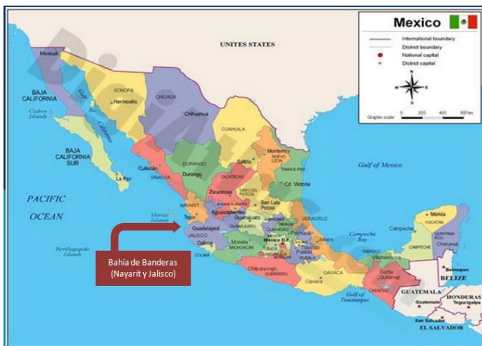
Figura 1. México. Bahía de Banderas localizada entre los Estados de Nayarit y Jalisco.