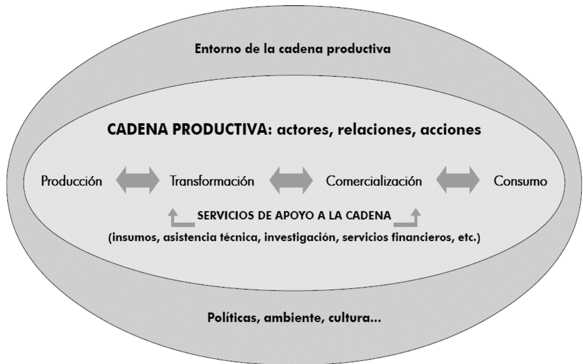
Figura no. 2 La cadena productiva y sus actores.

Según Heyden y Camacho (2004), se presenta un esquema de la cadena productiva y sus actores principales. Véase figura no. 2.