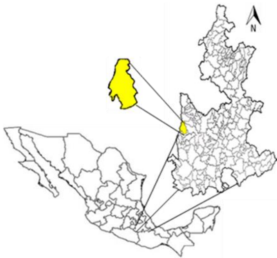
Figura 1. Localización del municipio de Tochimilco, Puebla.

Localización. El municipio de Tochimilco se encuentra en la parte centro oeste del estado de Puebla, en la región central de México (Figura 1) en las coordenadas 18° 50' y 19° 02' latitud norte y los meridianos 97° 18' y 97° 27' de longitud oeste (INEGI, 2009). El grado de marginación del municipio es alto (CONAPO, 2010).