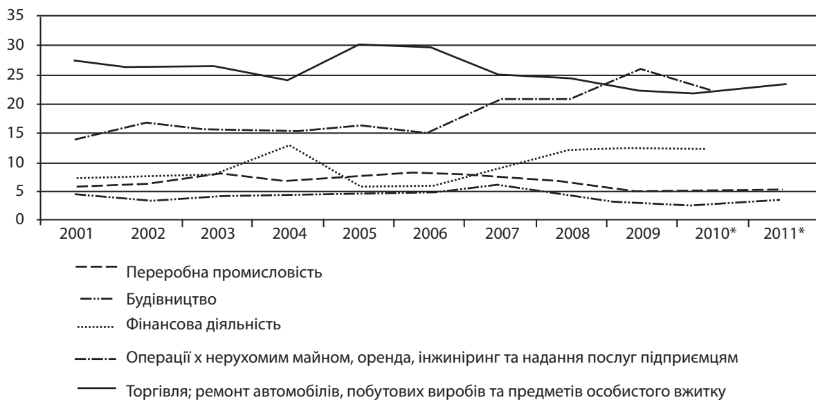
Рис. 4. Динаміка структури валової доданої вартості міста Київ у 2001–2011 рр.

інфраструктури, якості управління та комунального обслуговування. На такий ланцюжок причинно-наслідкових зв'язків звертають увагу російські дослідники [1].