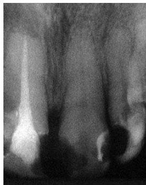
Slika 5b. Kontrola posle 6 meseci - Znatno poboljšanje Fig.5b. Check up after 6 months - Significant improvement