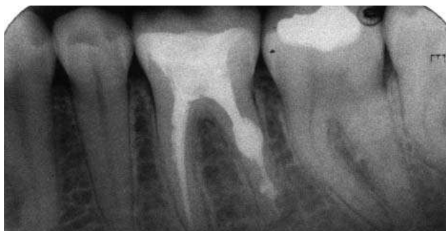
Slika 2b. Kontrola posle 6 meseci - izlječenje Fig.2b. Check up after 6 months - success

Kod eksternih apeksnih resorpcija 10 slučajeva je bilo sa produženom sekrecijom iz apeksa (vlažni kanali) i ovi kanali su nakon mehaničke obrade tretirani vodenom suspenzijom kalcijum hidroksida tokom četiri nedelje.