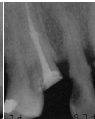
Slika 3b. Kontrolni snimak - izlječenje Fig.3b. Check up - success