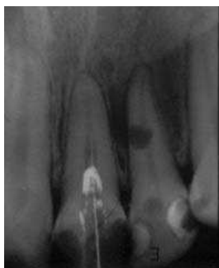
Slika 1a. Zub 12 - Interna resorpcija Fig.1a. Tooth 12 - Internal resorption

Kod šest slučajeva interne resorpcije sa inficiranim kanalom korena 12 meseci nakon završene terapije u pet slučajeva je konstatovano izlječenje , a u jednom slučaju posle šest meseci došlo je do pogoršanja i kliničke i rendgenološke slike (Tabela 2. Slika br. 3).