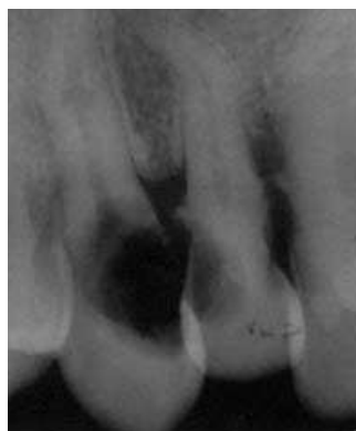
Slika 3a. Zub 23 - Apeksni parodontitis sa internom resorpcijom Fig.3a. Tooth 23 - Apical parodontitis with internal resorption