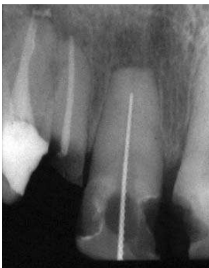
Slika 5a. Zub 21 - Eksterna amputaciona resorpcija Fig.5a. Tooth 21 - External resorption on apex