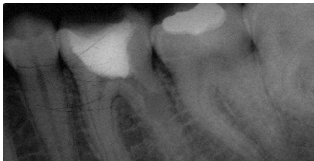
Slika 2a. Zub 46 - Multipla interna resorpcija Fig.2a. Tooth 46 - Multiple internal resorption