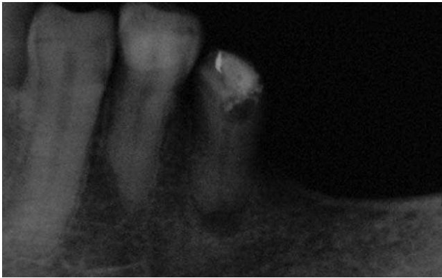
Slika 4a. Zub 35 - Apeksna inflamatorna resorpcija Fig.4a. Tooth 35 - Apical inflammatory resorption