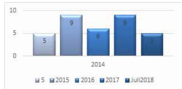
Grafik.1 Jumlah Kasus Kerusuhan dan Pemberontakan

Sumber paparan Direktorat Jenderal Pemasyarakatan Temu Ilmiah Pemanfaatan Hasil Kajian Badan Penelitian dan Pengembangan Hukum dan HAM Tahun 2018