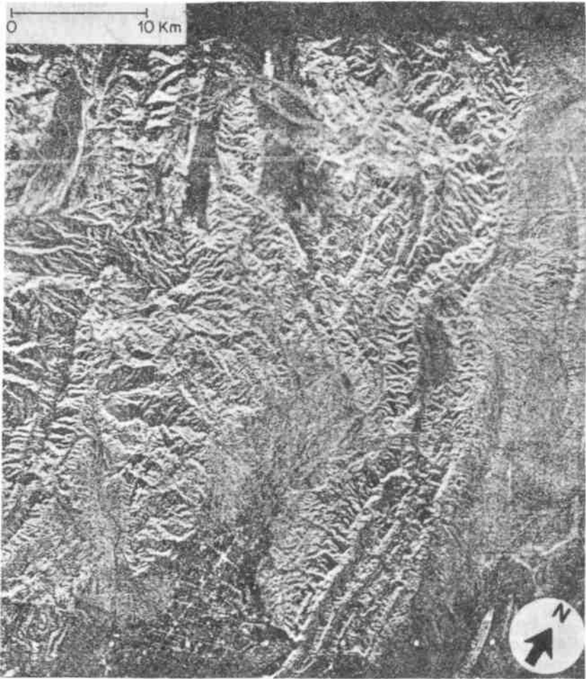
Fig. 3.- Imagen de radar sobre la ciudad de Jáchal, San Juan, obtenida por la misión SIR-A.

características cercanas a la superficie, tales como oleaje, corrientes marinas, viento en superficie, topografía de la superficie y cobertura de hielo. El Seasat dio, por primera vez, imágenes sinópticas de radar de la superficie de la Tierra, tanto del área oceánica como del suelo, obtenidas desde una plataforma en órbita, y además, con una resolución de 25 m. El éxito de este complejo sensor abrió una nueva dimensión en la capacidad del hombre para observar, monitorear y estudiar la superficie terrestre. Lamentablemente, debido a una falla en el sistema eléctrico, sólo estuvo activo 98 días.