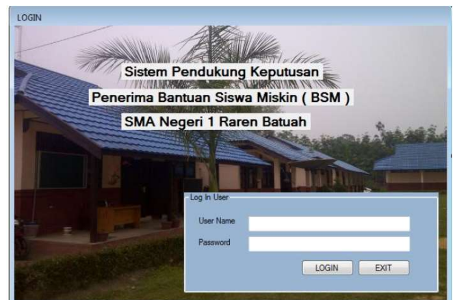
Gambar 6. Form Login

Form Login merupakan halaman yang digunakan untuk masuk ke dalam Aplikasi Sistem Pendukung Keputusan Bagi Penerima Bantuan Siswa Miskin (BSM) Menggunakan Metode Simple Additive Weighting (SAW) Di SMA Negeri 1 Raren Batuah Kabupaten Barito Timur. Jika username dan password benar, maka pengguna akan masuk ke dalam halaman Menu Utama. Jika salah, maka pengguna harus kembali memasukkan username dan password sampai benar.