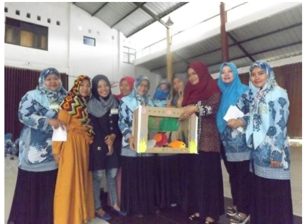
Gambar 4. Pendampingan Praktik Pembuatan Media Pembelajaran bagi AUD