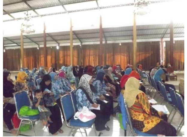
Gambar 2. Pemberian Materi terkait Pelaksanaan Pembelajaran bagi AUD