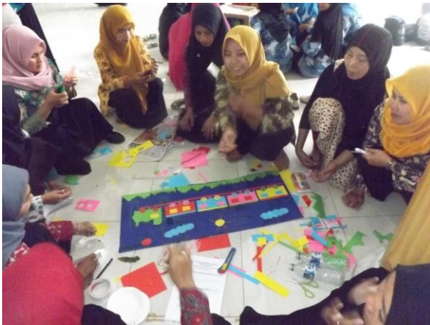
Gambar 3. Pendampingan Praktik Pembuatan Media Pembelajaran bagi AUD