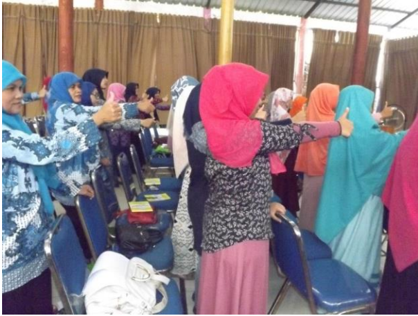
Gambar 1. Pemberian Materi terkait Pelaksanaan Pembelajaran bagi AUD