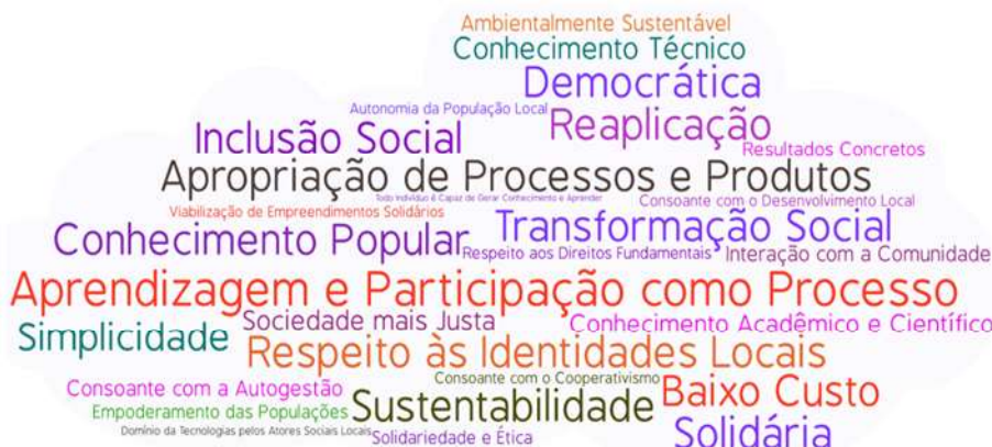
Figura 2: Nuvem dos princípios da Tecnologia Social.