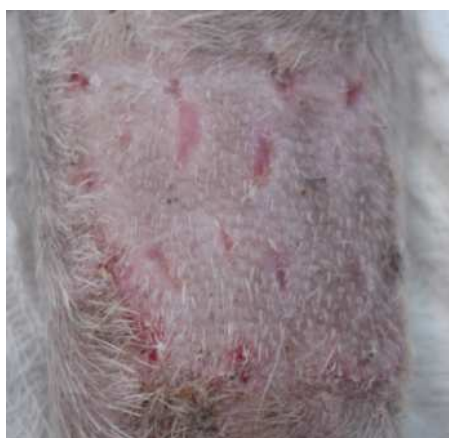
Figura 4. Crescimento piloso e total sobrevivência do enxerto ao décimo dia após enxertia cutânea.

Podemos observar o enxerto com aspecto relativamente normal, com crescimento piloso a partir do décimo dia após enxertia (FOWLER, 2006) (figura 4).