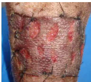
Figura 2. Aspecto cianótico esperado após 48 horas de enxertia cutânea.

O líquido absorvido também se difunde para os tecidos intersticiais do enxerto, produzindo edema; este edema atinge seu máximo por volta de 48 a 72 horas após a aplicação do enxerto. A circulação é restabelecida nesse momento, aproximadamente; no entanto, é possível que o retorno venoso não seja adequado, e que o edema aumente. Com a melhora das drenagens venosa e linfática, o líquido é eliminado do enxerto, e ocorre a regressão do edema. Assim, o enxerto retorna ao seu peso normal por volta do oitavo dia de pós-operatório (POPE, 1996). (Figura 3)