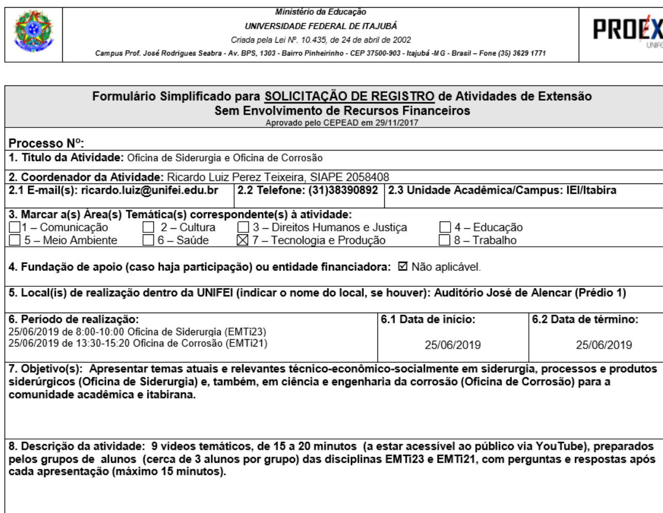
Figura 1. Solicitação de registro das oficinas de extensão na universidade.

Conforme normas na universidade, o pedido de oficinas de Siderurgia e Corrosão foi registrado formalmente e, no registro da atividade de extensão, informado que a oficina constaria como um módulo para extensão das disciplinas obrigatórias do terceiro ano em engenharia de Siderurgia e de Corrosão, conforme apresentado na Fig. 1. A atividade de extensão oficina foi registrada pelo docente coordenador,