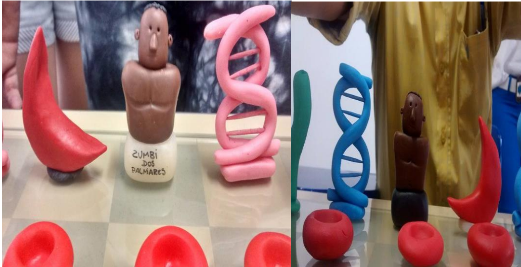
Figura 1 Perspectiva do jogo de xadrez. Rei=Zumbi dos Palmares rainha=hemácia falciforme, bispo=DNA, peões=hemácia normal.