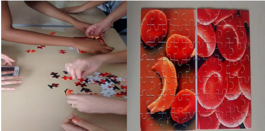
Figura 4 Alunas separando as peças do quebra cabeça, quebra cabeças montados.