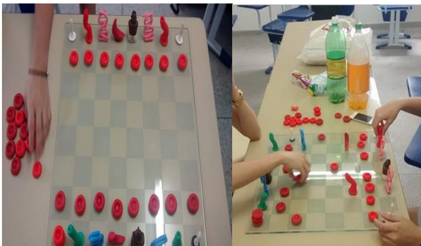
Figura 2 Montagem do tabuleiro, alunas jogando.