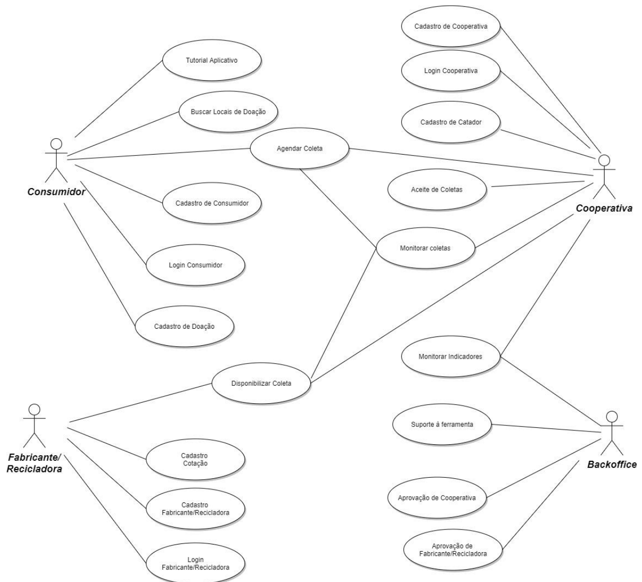
Figura 3 – Diagrama de Caso de Uso da Plataforma REEEicla

A Figura 3 ilustra a plataforma REEEicla da perspectiva do usuário em forma de Casos de Uso. Neste tipo de diagrama da UML, os usuários são representados por atores cujos papéis estão em concordância com a PNRS. As formas de elipses são funcionalidades da plataforma de software acessadas pelos atores. Atividades realizadas fora da plataforma não possuem representação neste diagrama. Caso uma atividade realizada fora da plataforma, e que não exista no levantamento inicial de requisitos, passe a ser necessária, ela pode ser implementada a qualquer momento, como uma atividade de melhoria contínua.