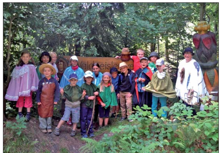
Waldgeisterwanderung in Ehrenfriedersdorf

Am Ende wurden die Kinder mit einem Schatz belohnt und stärkten sich an einer Quelle, an der sie unbesiegt werden sollten. Wir werden ja sehen, ob der Waldschrat da nicht ein bisschen geflunkert hat.