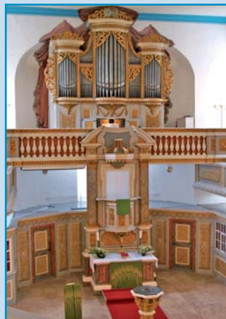
Nicht nur die Orgel, sondern auch der Kanzelaltar und die Taufe stammen aus der Werkstatt Silbermanns.