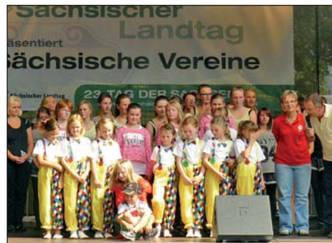
Tanzgruppe beim Tag der Sachsen

Die Tanzgruppen des SV Grün-Weiß Lippersdorf und der Evangelischen Kindertagesstätte „Apfelbäumchen“ präsentierten sich auch in diesem Jahr wieder zum Tag der Sachsen. Mit einem großen Reisebus starteten wir am Samstagvormittag, dem 6. September. Bis auf den letzten Platz war der Bus