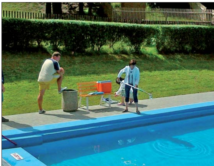
Wasseranalyse des Landratsamtes