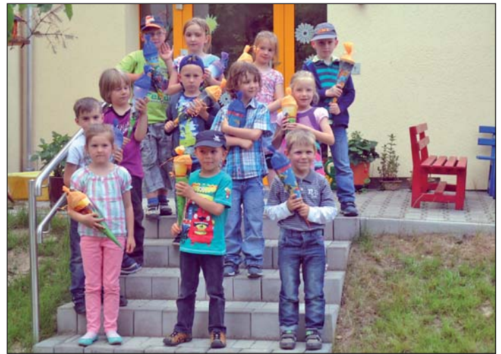
Zuckertütenfest der Wassertröpfchen-Gruppe

Ende Juni feierten wir vormittags gemeinsam mit den anderen Kindern der Kindertagesstätte das Zuckertütenfest. Natürlich waren auch in diesem Jahr Zuckertüten gewachsen. Nachmittags entdeckten wir die Geheimnisse der Sagerhütte in Olbernhau und spielten Bowling. Danach zeigten die Vorschulkinder den Kindern der 4. Klasse und den Erzieherinnen eine kleine Miniplaybackshow. Traditionell übernachteten die Schulanfänger im Kindergarten. Müde krochen alle spät abends in ihre Schlafsäcke. Es war ein sehr schöner und erlebnisreicher Tag für uns alle.