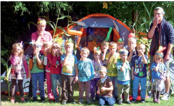
Sonnenkinder-Gruppe beim Indianerfest