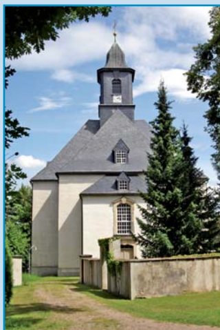
Die Forchheimer George-Bähr-Kirche, die man schon von Ferne erkennen kann.