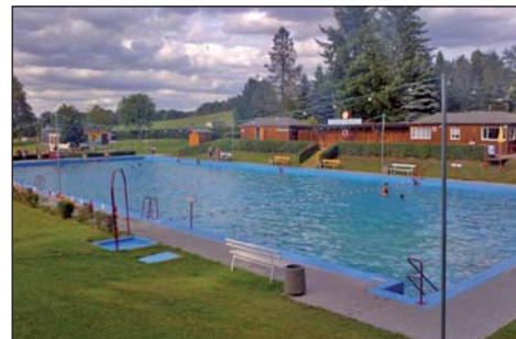
Das neu sanierte Bad