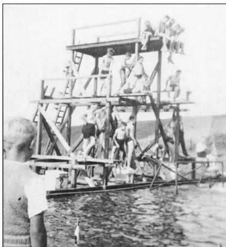
großer Holzsprungturm um 1930

Nach der Wiedervereinigung 1990, gründete sich der Schwimmbadverein. Dieser erhielt in Zusammenarbeit mit der Stadt Lengefeld bis 2014 den Badebetrieb aufrecht und leistete unzähligen Stunden ehrenamtliche Arbeit zur Aufrechterhaltung und Pflege des Bades.