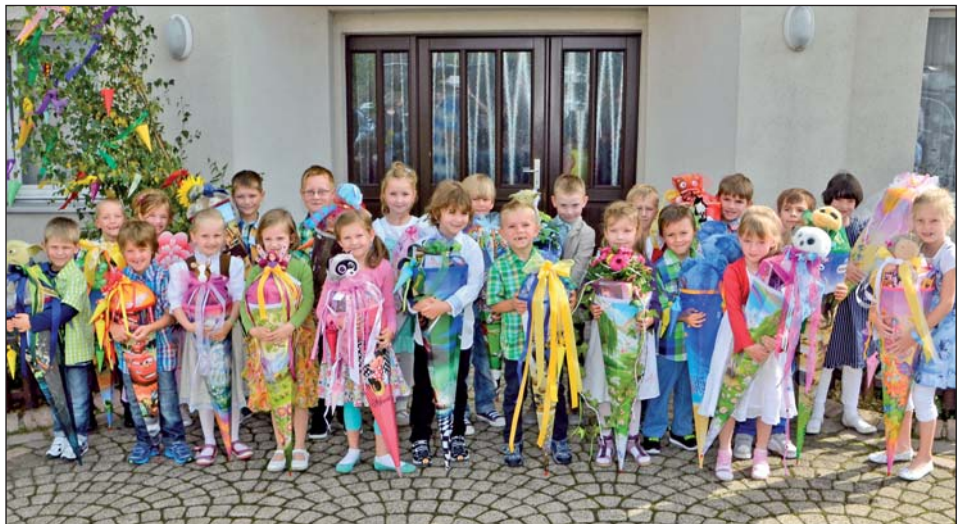
Die Schulanfänger vor der Jahn-Halle in Wünschendorf.