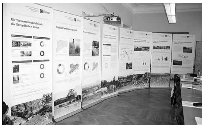
Wanderausstellung des Landesamtes für Umwelt, Landwirtschaft und Geologie (LfULG) zur EU-Wasserrahmenrichtlinie

Weitere Informationen zur Ausstellung und zum Projekt finden Sie unter www.baechle-lebensadern.de